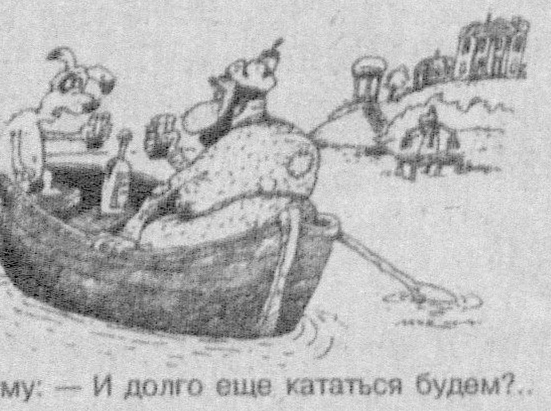
Муму: — И долго еще кататься будем?..

В чем секрет вашего необыкновенного долголетия? — Да какой там секрет? Просто нет денег на похороны.