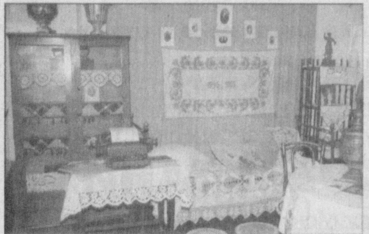
Роза Григорьевна. НА СНИМКЕ: экспозиция ретровыставки чирчикского музея.

ТАШКЕНТ. (Корр. УзА А.Иванова). «Чарвак-2004» - под таким названием в оздоровительном лагере «Ок елкан», расположенном в Бостанлыкском районе столичной области, состоялся экологический фестиваль детского художественного творчества. Он был проведен под лозунгом «Экосан» - детям Арала» Международной организацией