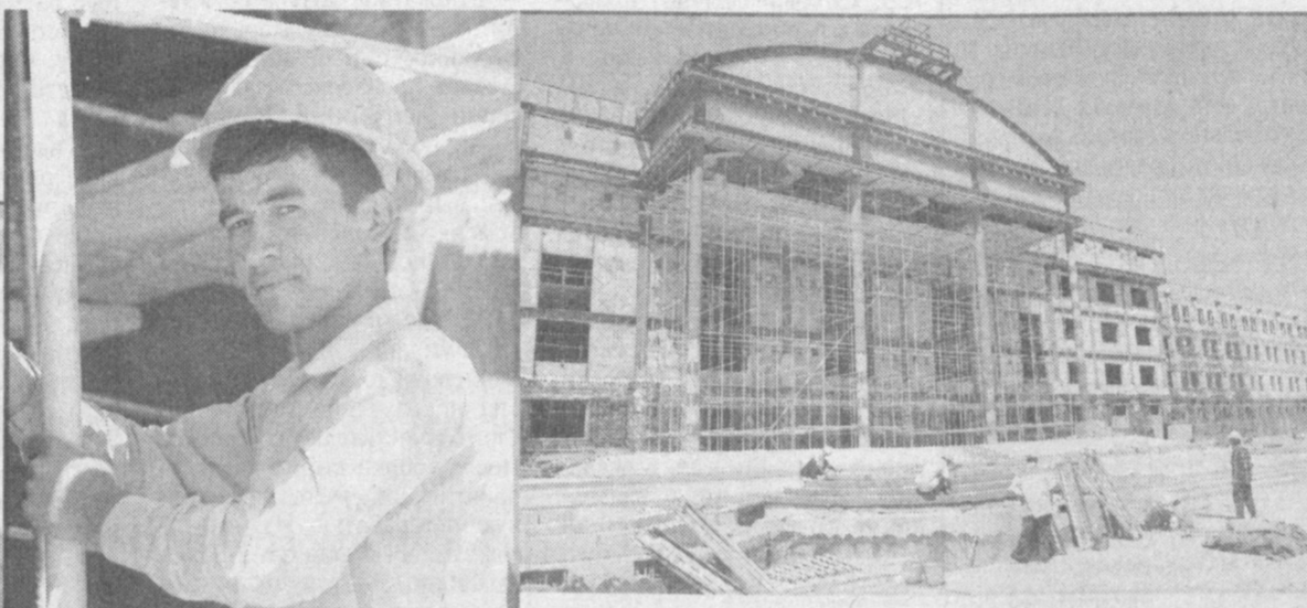
На столичной площади Мустакиллик продолжается строительство административного здания Сената - верхней палаты Олий Мажлиса Республики Узбекистан.

Это великолепное здание, возводимое по инициативе руководителя нашего государства Ислама Каримова, сооружают по заказу компании «Ягона буржумчи хизмати инжиниринг» («Служба единого заказчика инжиниринг») генподрядчики - акционерные общества «Стройтрест-12» и «Стройтрест-159».