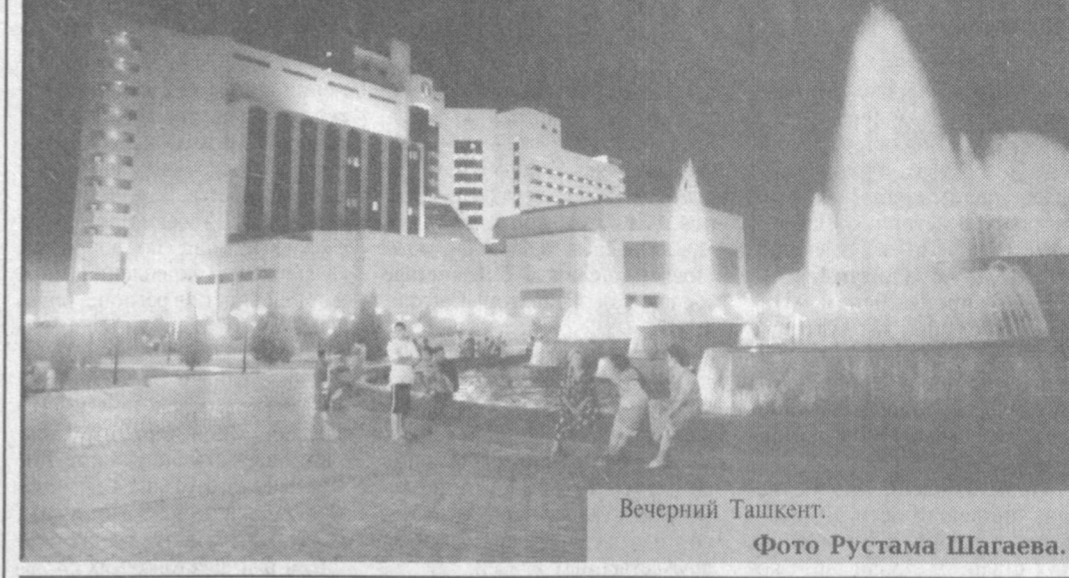
Вечерний Ташкент.

По инициативе ахсакалов махалли Терак-таги кишлака Заирак Анджианского района создан Фонд милосердия. Средства фонда, пополняемые за счет добровольных взносов местных предпринимателей и фермеров, будут направляться на оказание материальной помощи малоимущим, многодетным семьям, инвалидам, одиноким жителям махалли, нуждающимся в материальной поддержке. Контролировать распределение средств поручено созданному при махаллинском сходе граждан попечительскому совету фонда. К.Низамов. НИА «Туркистон-пресс».