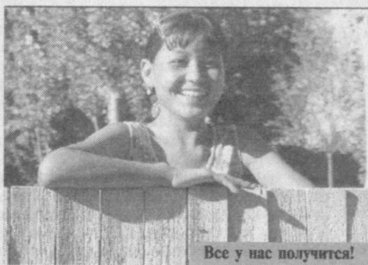
Все у нас получится!