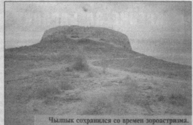
Чылык сохранился со времен зороастризма.

Запоминаем, как разителен контраст: с той стороны шлагбаума - пустыня, а по другую что только не зеленеет. А вот и туранга. Меж ней встречаются кустарники, земля же под деревьями усеяна мелкими сухими ветками. Много чего