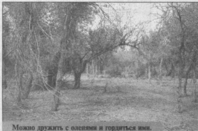
Можно дружить с оленями и гордиться ими.

«И вы это терпите? Взяли бы да отстреляли! На них ведь охота разрешена». Мне в момент беседы вспомнился фильм из детства про охотников на волков. Борьба велась упорная. Волки были хитрые и сильные, и, как в известной песне Высоцкого, стремились за красные флажки. Но доблестный