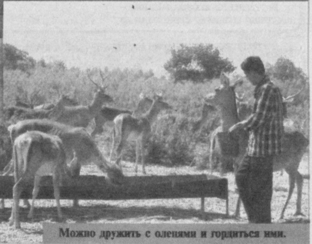
Можно дружить с оленями и гордиться ими.

но борются с термитами, а эта угроза - хуже ураганов.