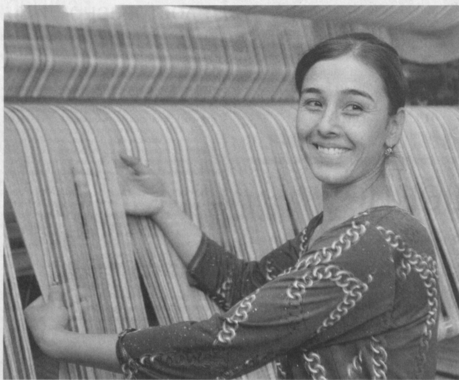
Производимые в ООО "Глобал мега текстиль" в Жондорском районе Бухарской области полотенца отличаются красивой расцветкой и качеством.

В обществе, где работает более ста человек,