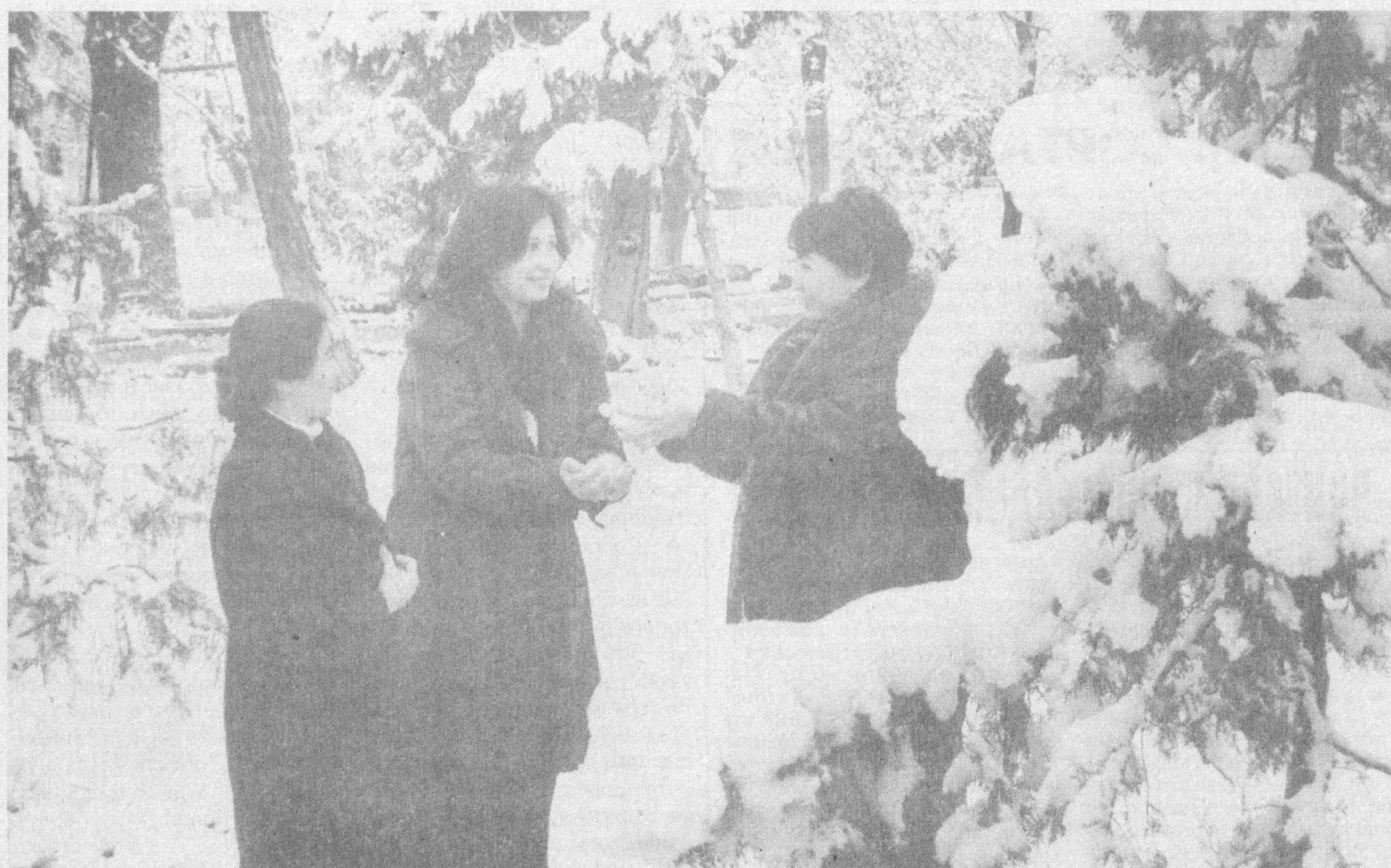
Мы радуемся всему. Особенно, когда в нашем доме мир и дружба. Первый снег. Он был. Счастливы дети, родители смотрели на них и понимали: какое это благо — здоровое поколение. Нынешний год объявлен Президентом Годом здорового поколения. И пусть опять выпадет снег, но души наши останутся теплыми и чистыми.