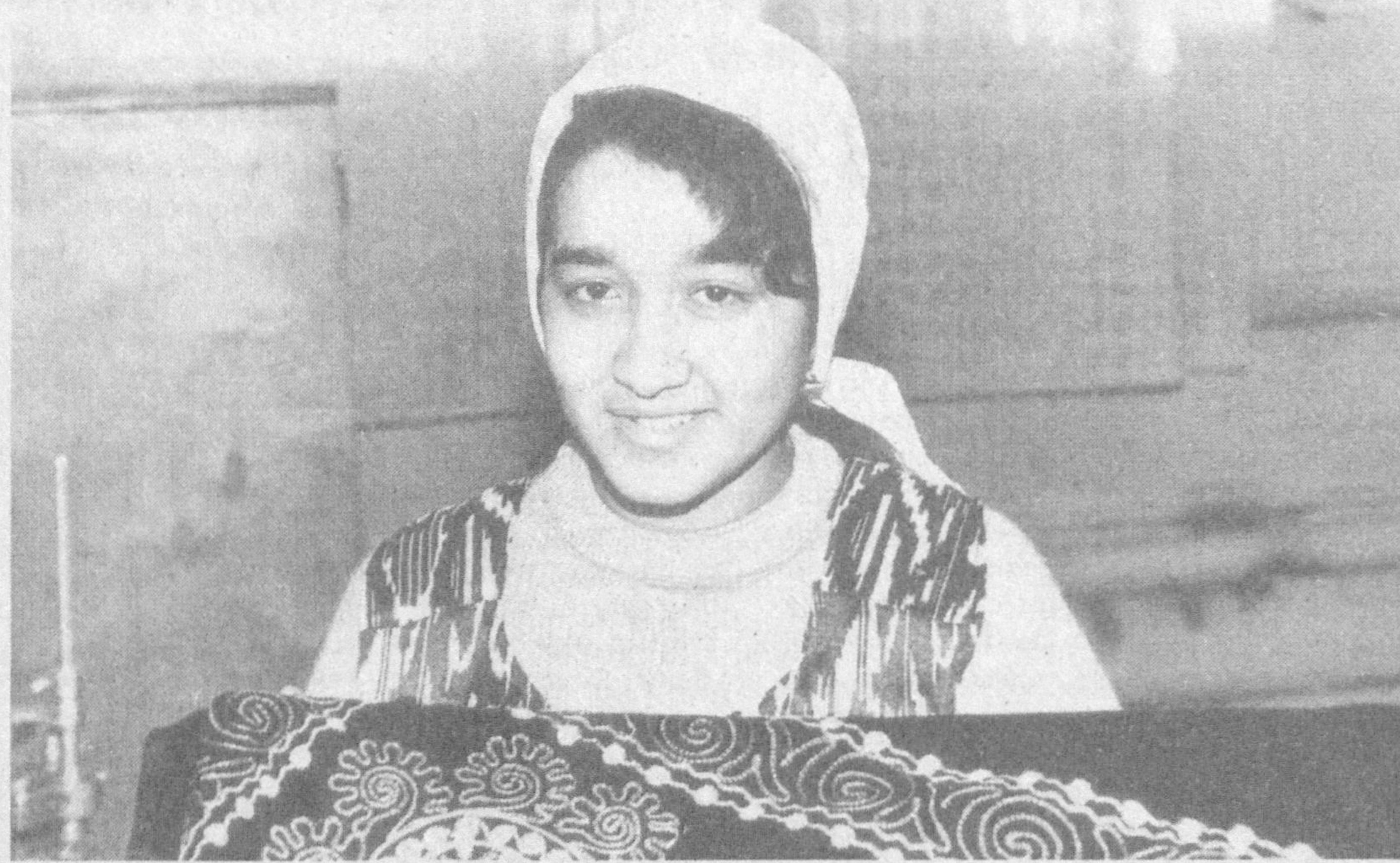
Акционерное общество с ограниченной ответственностью «Шарк гули» производит широкий ассортимент продукции — яркие сумки, разные покрывала, памятные сувениры и другие изделия. Всего тридцати наименований. Ни одна узбекская семья не обходится без них. Продукция в основном реализуется на внутреннем рынке и туристам из зарубежных стран.

Олег ШАТУНОВСКИЙ, собр. корр. ИА «Жахон»