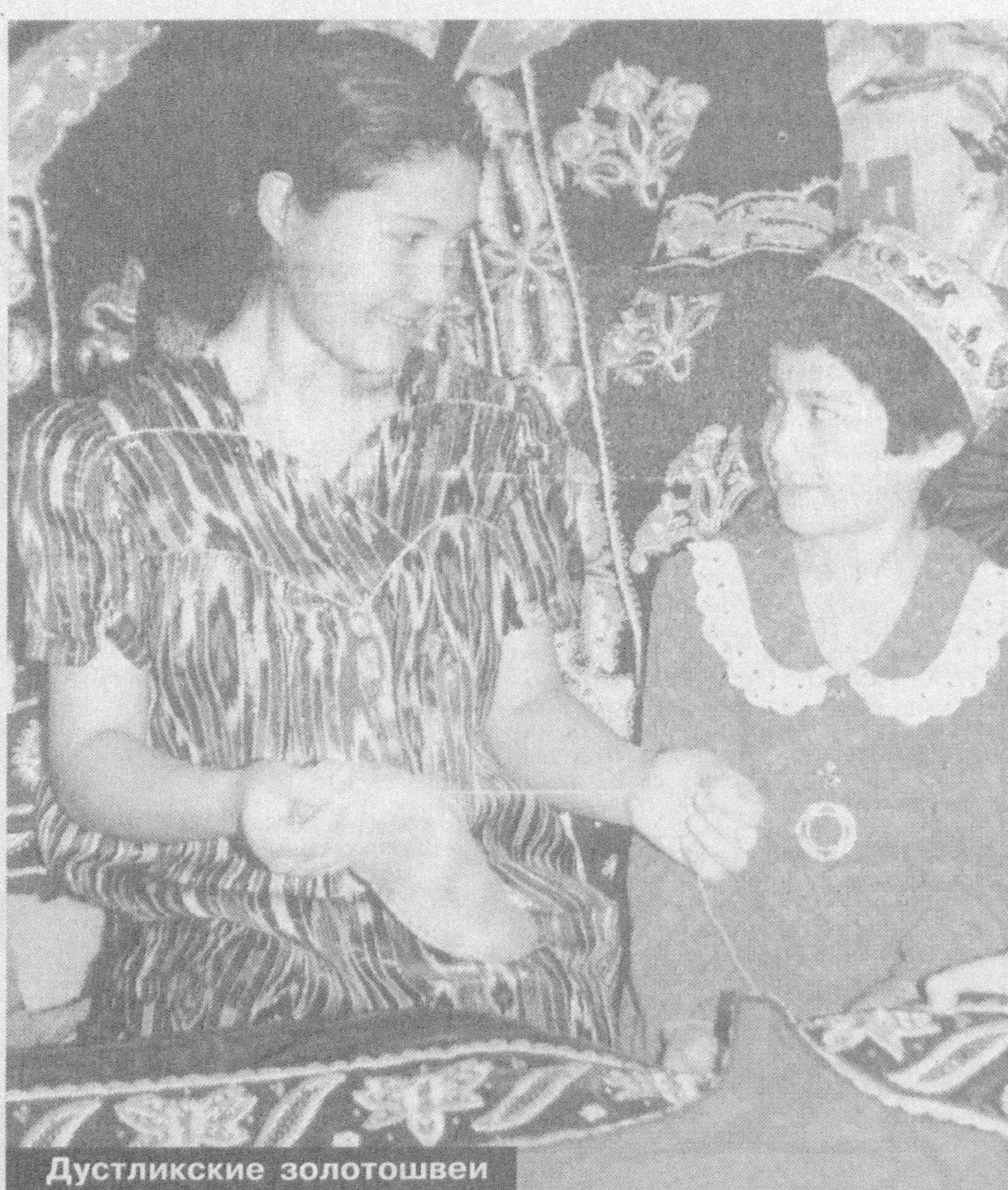
Дустликские золотошвей

«Великий шелковый путь» — такова тема художественного конкурса, объявленного для учащихся школ республики. Его организатором выступило представительство ЮНЕСКО в нашей стране. Эта крупнейшая международная организация поддерживает самые тесные контакты с Министерством народного образования, на протяжении ряда лет реализует совместные программы и проекты. Одним из них стала, к примеру, организация образовательных центров, действующих сегодня в двух регионах республики. Кроме того, 24 образовательных учреждения получили статус ЮНЕСКО и постоянно получают от него методическую и техническую поддержку. Учащиеся эти школ и станут главными претендентами на победу в объявленном конкурсе, целью которого является углубленное изучение детьми истории своего края, воспитание у юных патриотических качеств. Итоги состязания будут подведены к середине марта, когда намечено провести и презентацию книги «Великий шелковый путь», изданной при участии представительства ЮНЕСКО.