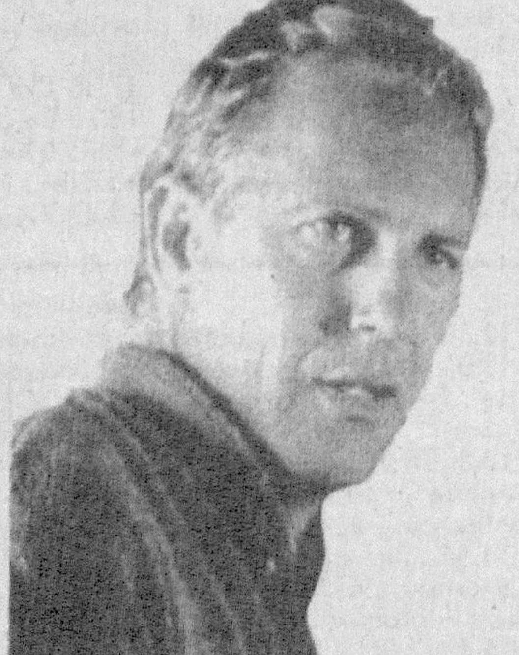
«КОЗЯВЧОНАЯ ЮНОСТЬ» СЕКС-СИМВОЛА

Дебют Кевина Костнера на актерском поприще состоялся почти 20 лет назад. За эти годы он успел «наследить» практически во всех жанрах кино: начиная от вестерна и фантастики и заканчивая романтическими мелодрамами. Нам он хорошо знаком прежде всего по яркому фильму «Телохранитель». Ныне Костнер — одна из легенд Голливуда.