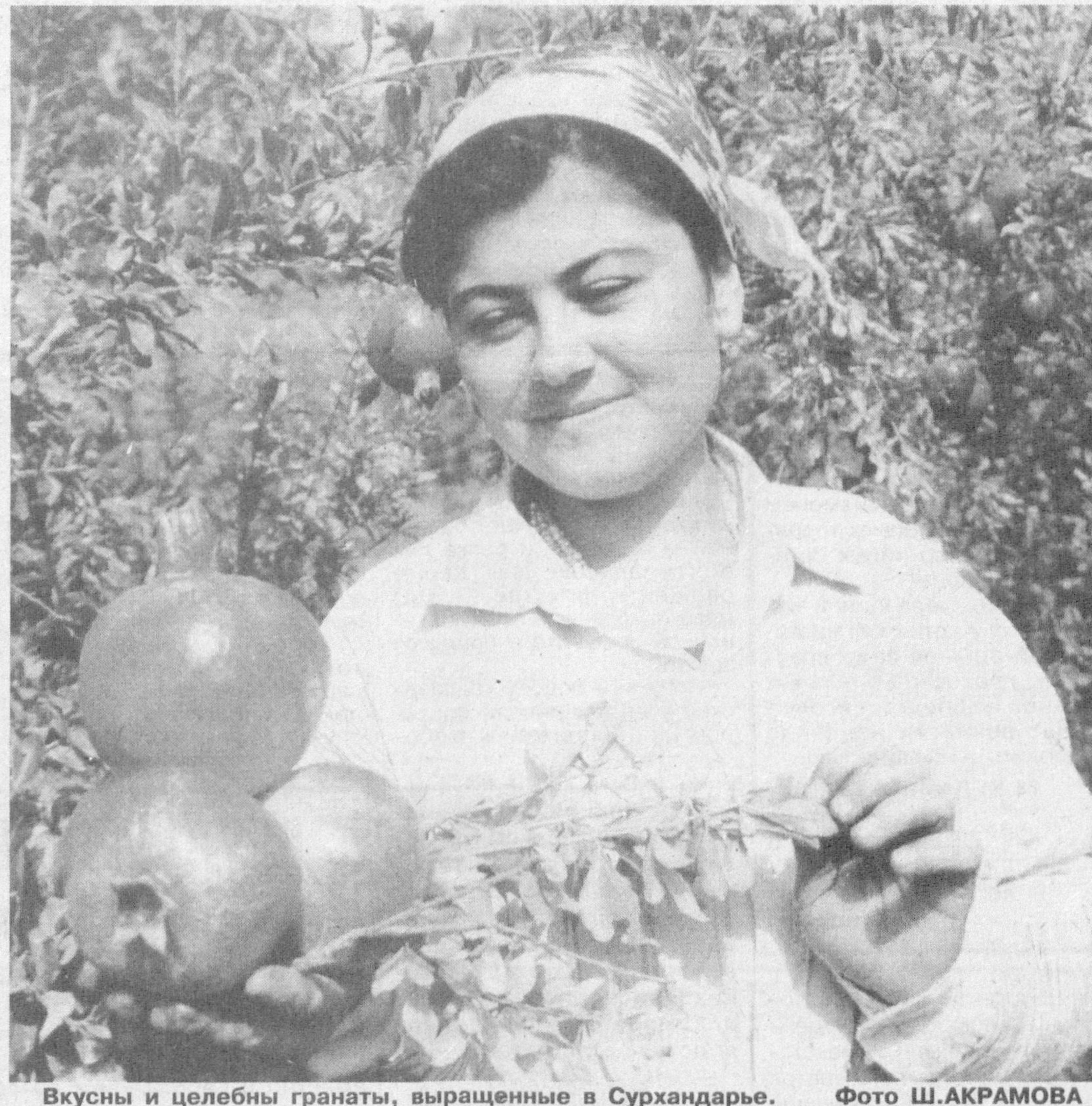
Вкусны и целебны гранаты, выращенные в Сурхандарье.