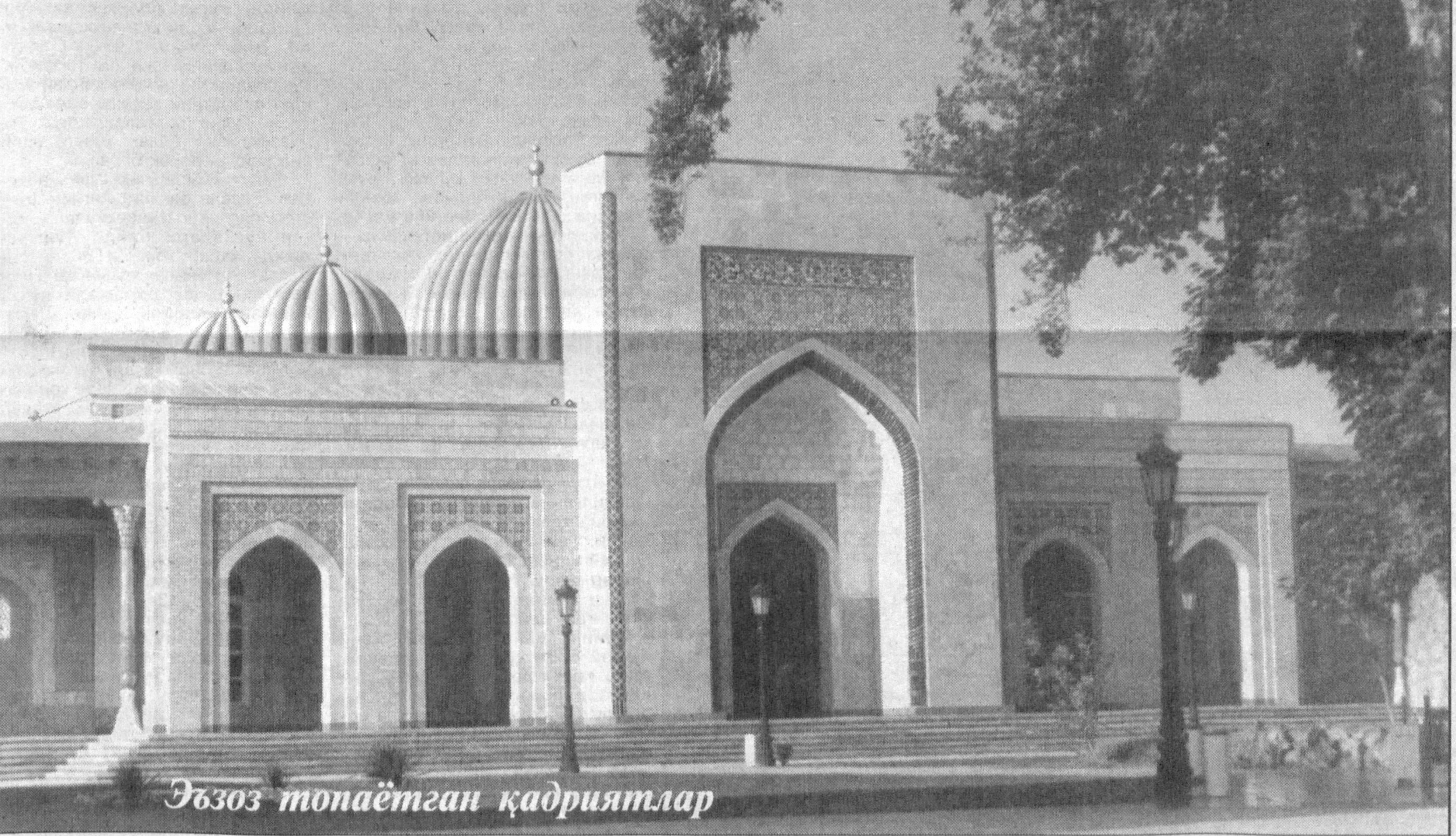
Ўзоз топаётган қадриятлар