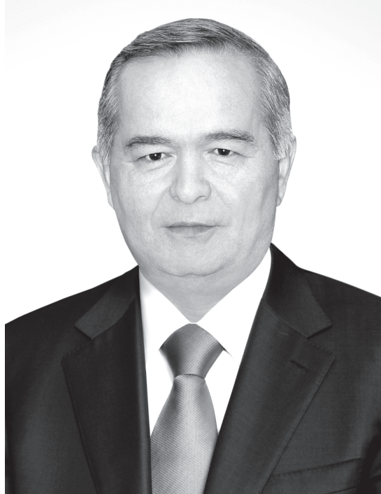
ИСЛОМ АБДУГАНИЕВИЧ КАРИМОВ

Ислом Абдуғаниевич Каримов 1938 йил 30 январда Самарқанд шаҳрида хизматчи оиласида туғилган. Миллати — ўзбек. Олий маълумотли, Ўрта Осиё политехника ва Тошкент халқ хўжалиги институтларини тугатган. Муҳандис-механик ва иқтисодчи мутахассисликларига эга. Иқтисод фанлари номзоди.