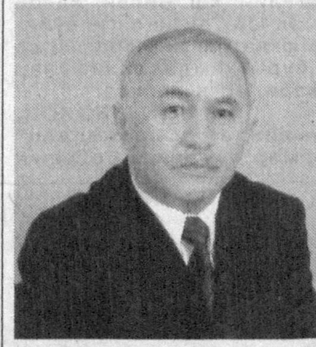
Хуршид ДЎСТМУХАММАД, Олий Мажлис Қонунчилик палатасининг Аxbорот ва коммуникация технологиялари масалалари қўмитаси раиси

Мен Президентимиз томонидан ҳар сафар янги йилга бериляётган номининг маъно-моҳиятини, мазмунини мушоҳада этиб, давлатимиз раҳбари нечоғли узоқни кўзлаб иш тутаятганига амин бўлман. 2005 йил “Сихат-саломатлик йили” сифатида тарихда