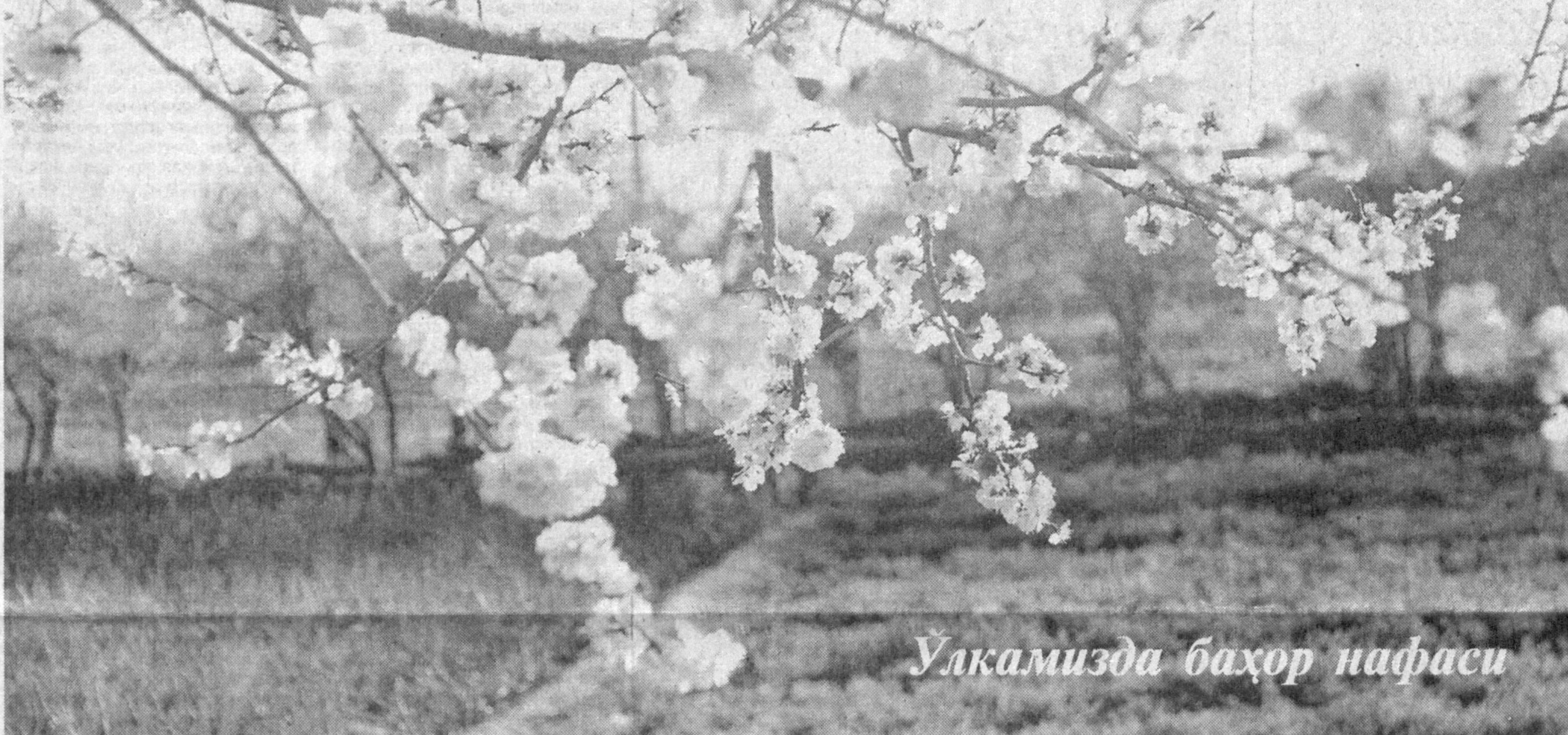
Улкамизда баҳор нафаси

ки, ижтимоий ҳавфи катта ва оғир оқибатларга сабаб бўладиган жиноятларга қўл урганлар: қонунчи, ўта хавфли рецидивистлар, жазони ўташ тартибини мунтазам бузаётганлар, шунингдек, муқаддам афв этиш ёки амнистия тартибида жазодан озоқ бўлган, яна қасддан жиноят содир этган кимсаларга адолатли қонунлар ҳам, одамлар ҳам бефарқ қарашмайди. Бундайларга нисбатан кеңиримли бўлиш зарурми ўзи, дегувчилар ҳам албатта, топилади. Аммо бағрикенгликни тақозо этувчи бошқа ҳолат ҳам мавжудлигини унутмаслик даркор. Гап "Амнистия тўғрисида"ги қарорнинг 1-бандида тоиланган шахслар: қонунчи, аёллар, ёшлар, қариялар, чет эл фуқаролари ҳақида кетаётганлигини балки илгаб олгандирисиз. Бошқа давлатларни қўя турайлик, Ўзбекистонимизда бир-бирига қарама-қарши бўлган ушбу икки ҳолатни тарозуга солса, шубҳасиз