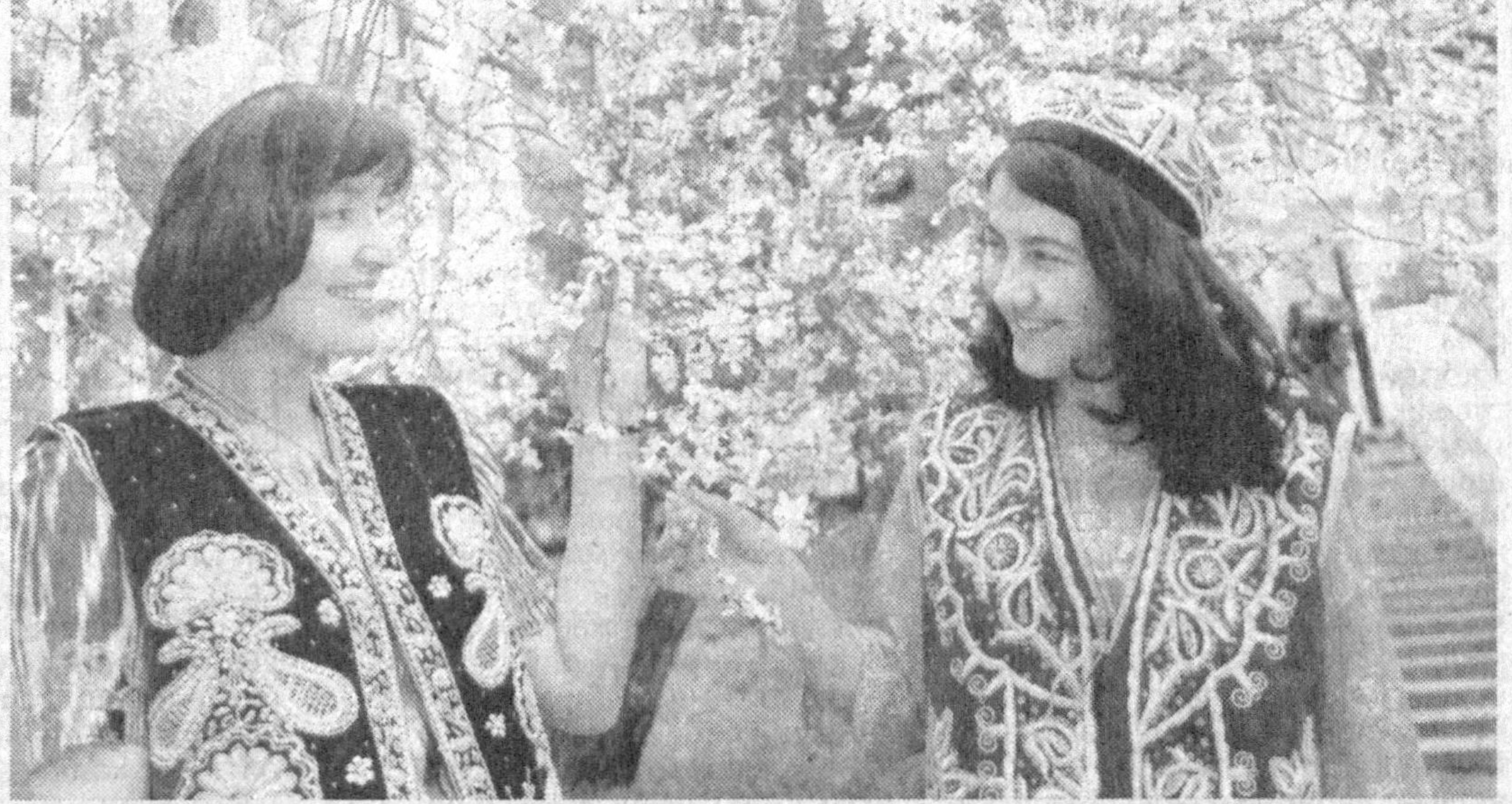
(Давоми. Боши биринчи бетда)

Президентимизнинг "Ўзбекистон Республикасининг давлат ва ижтимоий қурилишида хотин-қизларнинг ролини ошириш чора-тадбирлари тўғрисида"ги, "Болали оилаларни давлат томонидан қўллаб-қувватлашни янада кучайтириш тўғрисида"ги, "Хотин-қизларнинг ижтимоий муҳофазасини кучайтиришга оид қўшимча чора-тадбирлар тўғрисида"ги, "Зулфий номидида давлат мукофотини таъсис этиш бўйича тақлифларни қўллаб-қувватлаш тўғрисида"ги, "Ўзбекистон хотин-қизлар кўмитаси фаолиятини қўллаб-қувватлаш борасида қўшимча чора-тадбирлар тўғрисида"ги Фармонлари фарзандли оилаларга ижтимоий ёрдамни кучайтириш, аҳолини ижтимоий муҳофаза қилиш борасидаги чора-тадбирларни рўйбга чиқаришда фуқароларнинг ўзини-ўзи бошқариш идоралари маъвои ва масъулиятини ошириш, хотин-қизларнинг давлат ва жамиятни бошқаришдаги иштирокини кенгайтириш, уларнинг мамлакатимиз сиёсий-ижтимоий, иқтисодий ва маданий ҳаётида тўлиқ иштирокини таъминлаш, ёшларнинг маънавий ва интеллектуал савиясини юксалтириш борасида амалга оширилаётган ишларнинг самарадорлигини оширишга хизмат қилмоқда.