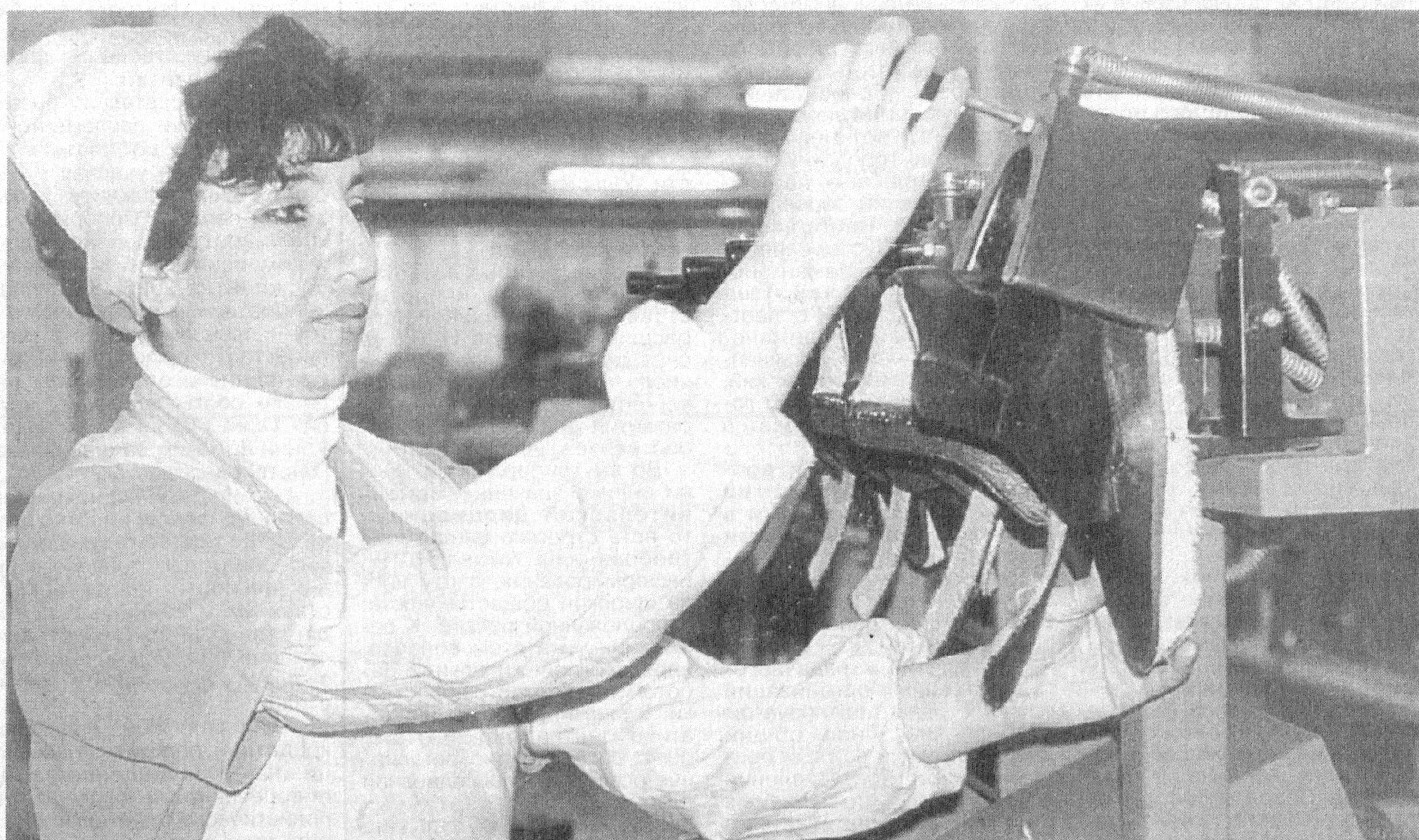
Благодаря взаимовыгодному экономическому сотрудничеству двух стран — Германии и Узбекистана в г. Чирчике создано совместное предприятие «Кибо». Здесь налажено производство высококачественной мужской и детской модельной обуви.

Навстречу 10-летию независимости Узбекистана