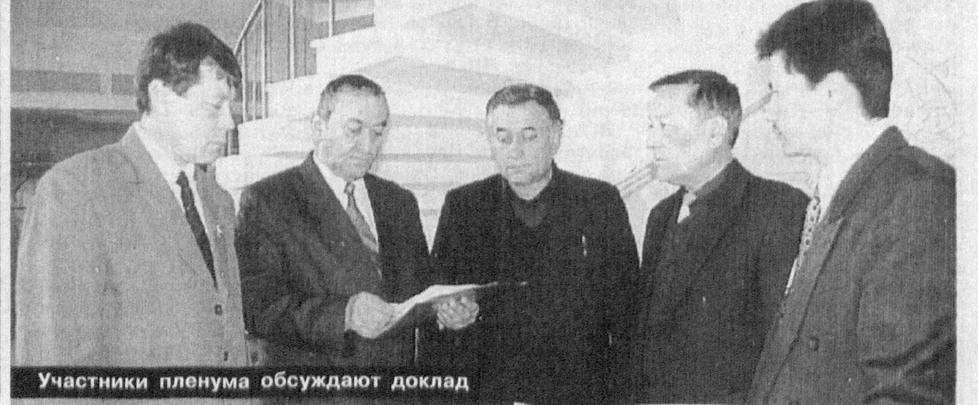
Участники пленума обсуждают доклад

В целях формирования позитивного мнения о парламентской деятельности НДПУ Узбекистана в печати, радио- и телерадиопередачах практиковать регулярное проведение пресс-конференций, брифингов, издание пресс-релизов и другие, общепринятые в мире формы информирования прессы и общественности по этим вопросам.