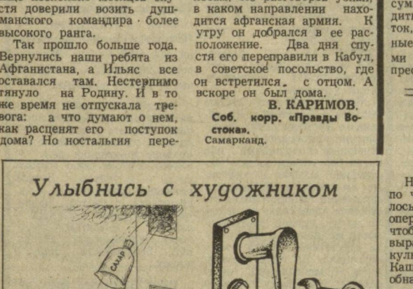
Рис. А. ХАКИМОВА и Р. ЭГАМБЕРДЫЕВА.