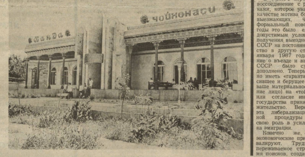
ФЕРГАНСКАЯ ОБЛАСТЬ. Новая чайхана «Ханда» («Улыбка») на 240 мест открыта в центре Маргилана. Ежедневно ее посещает около тысячи маргиланцев и гостей города. Построена она в национальном стиле. За годы 12-й пятилетки в городе построено 15 учреждений общепита на 2,614 мест.

А. ТАНХЕЛЬСОН, Спец. корр. «Правды Востока».