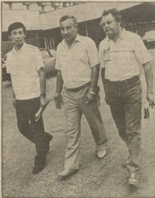
Наблюдением преступников, которые не расставались с автоматами. Любое сопротивление было равноценно гибели. Я понял, что мы спасены лишь тогда, когда одна из бандажеров была посажена в автобус. Что касается встречи с пакистанской землей, то ее можно назвать дружеской. Нас накормили, дали немного отдохнуть. По просьбе экипажа местные службы провели осмотр самолета. Ведь утончили грозили нам взрывным устройством.

Почти все, с кем мы, корреспонденты УэТАГ, общались этой тревожной ночью, были в состоянии стресса. И это не удивительно. Двое суток люди были в критической ситуации, многие из них пережили самые страшные минуты своей жизни. И это не просто слова. Преступники были готовы на все. Подтверждение тому — вывоз на землю разоруженных охранников в аэропорту Красноярска и Ташкента и демонстративная стрельба над их головами. Ссора между самими бандитами, которая чуть было не окончилась кровопролитием. Но это удалось избежать. Какой ценой?