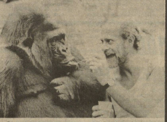
Горилла Диане из зоопарка в Бристоль (Великобритания) исполнилось 18 лет. Она отличается тем, что всегда неспроста поет... Вот и в день своего рождения Диана предпала на завтрак любимое лакомство — простояла. США, APRA и так хочется осветить...