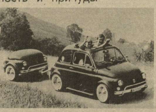
сельский дом, и называется станцией «Дереvня Далеm». Автомобиль и маленькая тележка.