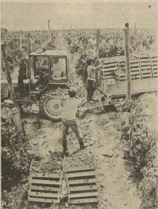
они объединяют около 70 процентов трудового населения совхоза. В хозяйствах рассчитывают увеличить заработную плату каждого работника в среднем на 170—180 рублей. НА СНИМКАХ: на выезде совхоза нынче будут производиться наряду с основной продукцией фруктовые соки; сбор урожая на виноградниках хозяйства.