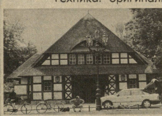
ЗАПАДНЫЙ БЕРЛИН. Вот такой необычный и привлекательный вид имеет здесь — как бы вы думали что? — одна из станций подземной городской железной дороги.