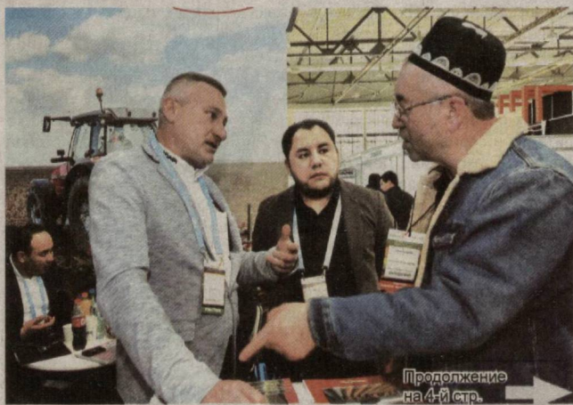
Продолжение на 4-й стр.

Более 170 крупных отечественных и зарубежных компаний приняли участие в завершившейся на территории НВК «Узэкспоцентр» международной выставке «Сельское хозяйство – AgroWorld Uzbekistan-2020».