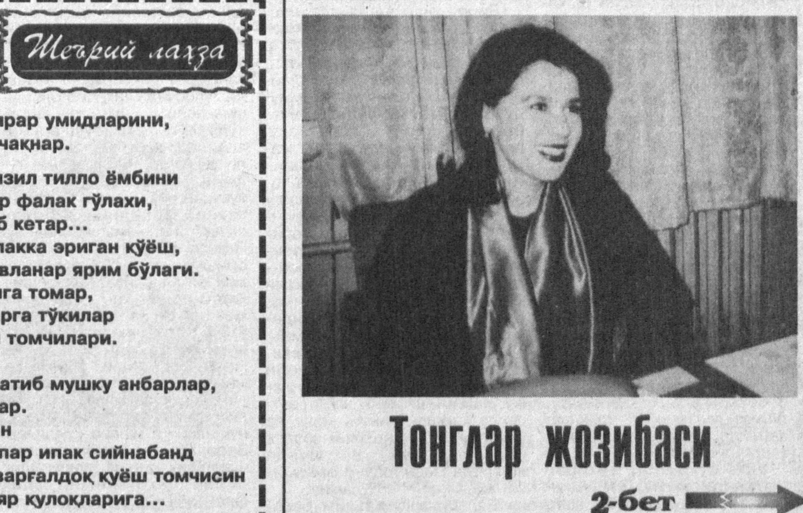
Тонглар жозибаси 2-бет

шакллантиришга қаратилгани Ўзбекистонда ҳозирги замон таълимнинг энг илғор жиҳатлари қамраб олинганидан далолат беради. Австралида бўлиб ўтган келгуси аср таълими — истиқболларига баъишланган «Осиё-Тинч океани минтақасида XXI асрда таълим муаммолари» деб номланган халқаро анжуманида таълимни ривожлантиришга қаратилган мақсуд давлат дастури фақат икки мамлакат — АҚШ ва Ўзбекистондагина мавжудлиги алоҳида таъкидлангани фикримизнинг далилидир.