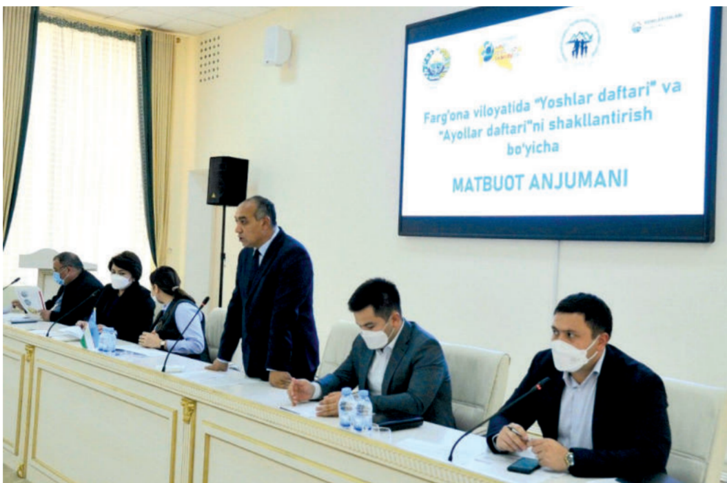
“Аёллар дафтари” шакллантирилган бўлди. Айти кунларда вилоятда Марғилон шаҳри ва Бешариқ тумани танаб олиниб, тажриба сифатида бир қатор ишлар бошлаб юборилди. Фарғона шаҳрида “Ёш-

Т емир дафтарга киритилган оилаларнинг 13 минг 661 таси маҳаллий кенгашларнинг қарорлари билан камбағаллик даражасидан чиқарилди. 59 мингта ижтимоий ҳимояга муҳтож ва кўп фарзандли оилалар, ногиронлиги бўлган шахслар, ёлғиз қариялар, ўз даромадини йўқотган вақтинча ишсиз бўлган шахсларга истеъмол товар маҳсулотлари, дори воситалари ҳамда нақд пуллар сектор аъзолари ва маҳалла фуқаролар йиғинлари ходимлари томонидан етказиб берилди. 35 минг 830 та оилаларнинг 142 минг 620 нафар аъзоларига 31 миллиард 376 миллион сўм миқдорда моддий ёрдам маблағлари тарқатилди.