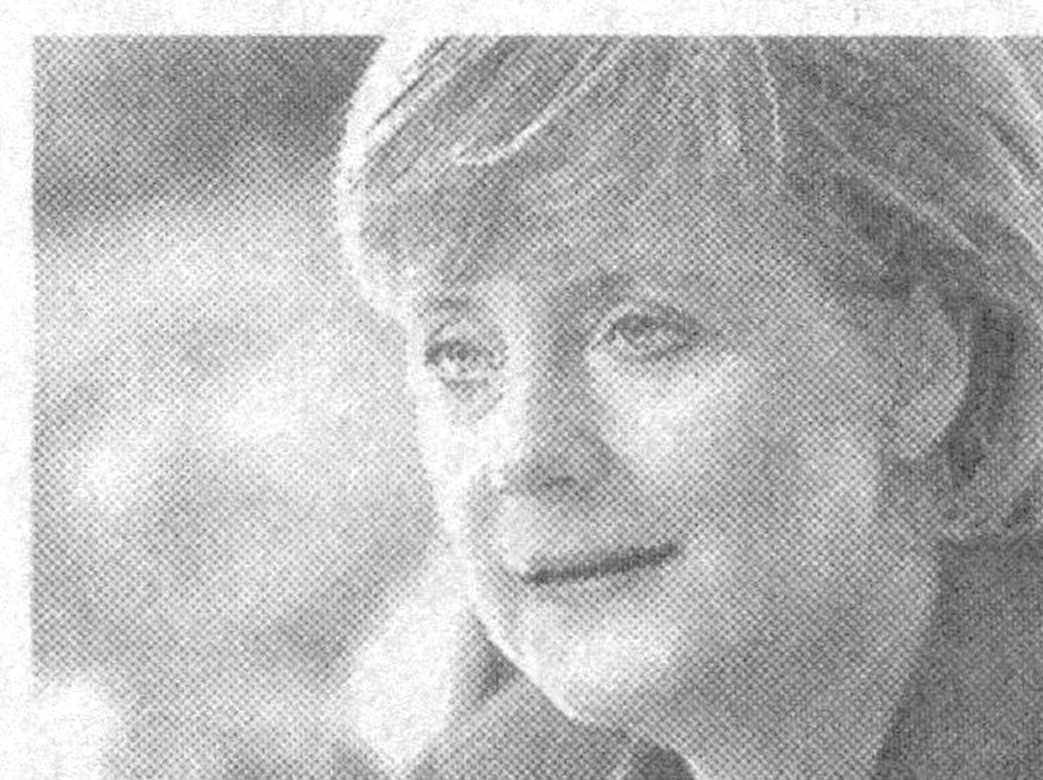
данным, разочарованный Шредер уже заявил о своем уходе из политики и отказался от предложенного ему поста министра иностранных дел. НА СНИМКЕ: Ангела Меркель

бы правительство страны впервые в ее истории возглавила женщина — лидер ХДС Ангела Меркель. Теперь основной интригой остается состав нового правительства Германии и судьба членов прежнего кабинета, в первую очередь, бундесканцлера Герхарда Шредера. По некоторым