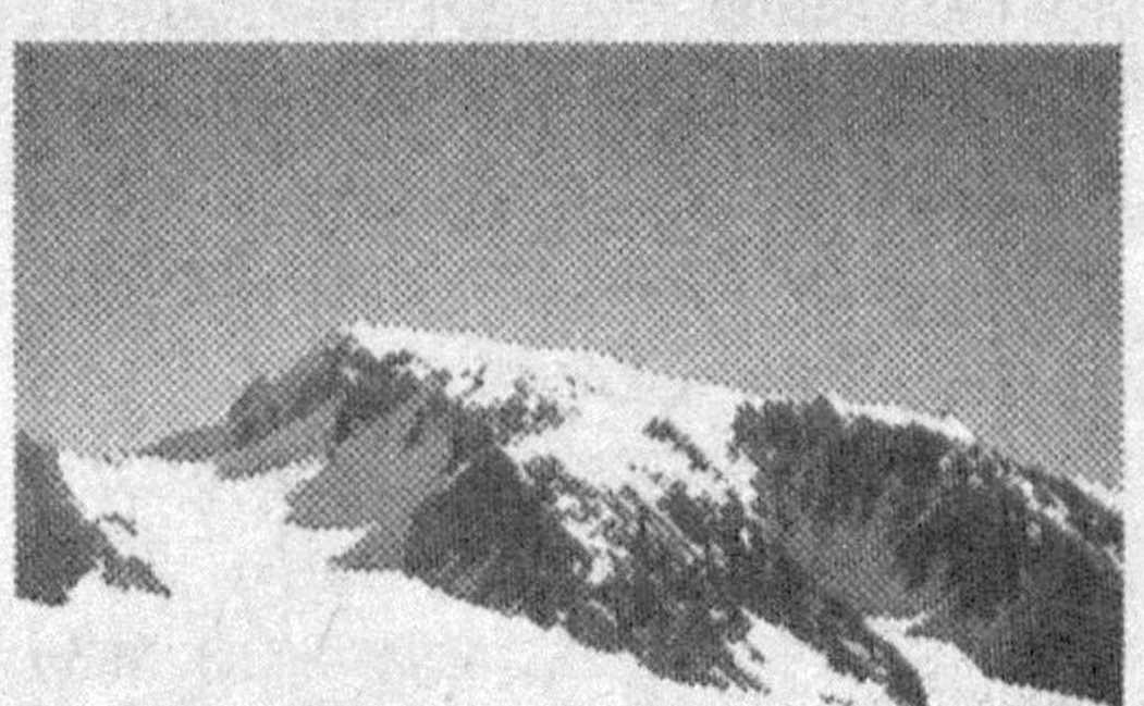
ниях не поступало», — уточнили в МЧС. Это уже третье землетрясение, которое зафиксировано в Алма-Ате за последнюю неделю.

Недалеко от Алма-Аты в ночь со среды на четверг произошло новое землетрясение силой 2-2,5 балла по шкале Рихтера. По данным МЧС, подземные толчки ощущались в Алма-Ате. «Сообщений о жертвах, пострадавших и разруше-