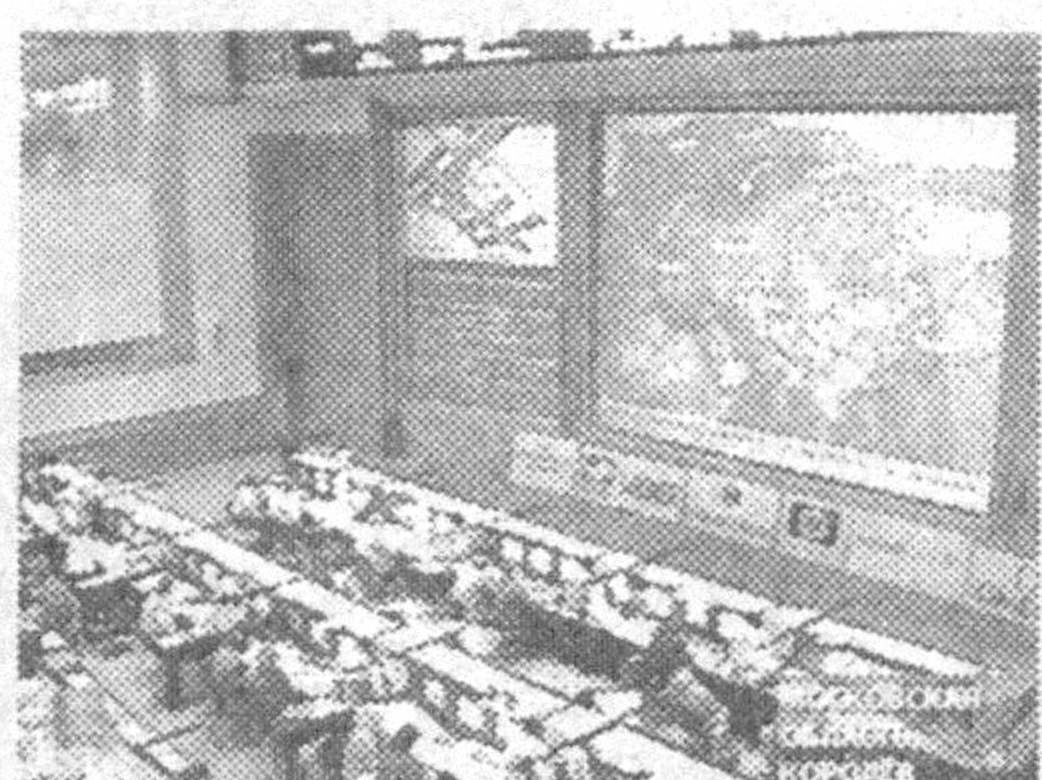
На борту МКС прошла церемония передачи космической вахты. Новым командиром станции стал астронавт NASA Уильям Макартур, обязанности бортинженера теперь исполняет Валерий Токарев.

На землю вернулись Сергей Крикалев и Джон Филлипс, экипаж 11-й экспедиции на МКС, а также третий космический турист, американский мультимиллионер Грегори Олсен, который провел на космической станции неделю.