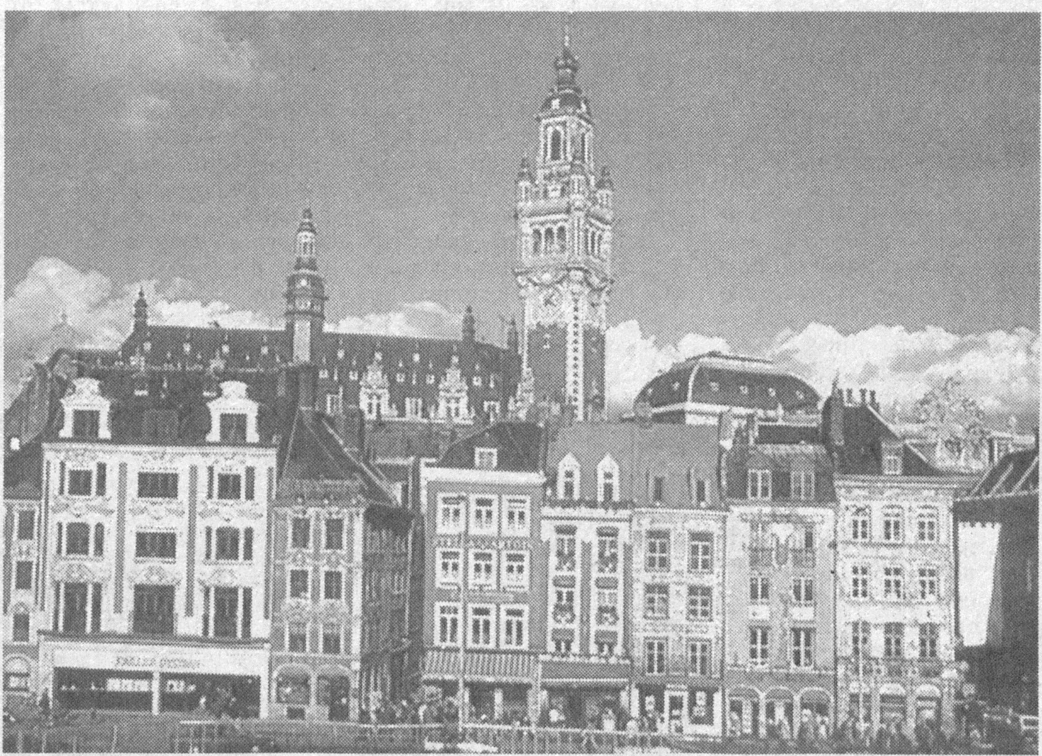
Франция. Лилль. Площадь Шарля де Голля.