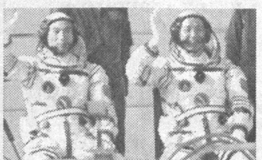
Китайский космический корабль «Шэньчжоу VI»