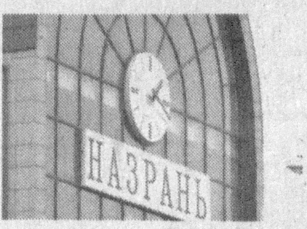
На федеральной трассе «Кавказ» в районе Назрани было обезврежено мощное взрывное устройство, передает агентство «Интерфакс».

По данным пресс-службы МВД Ингушетии, самодельную бомбу нашли на 570 километре федеральной трассы в муниципальном округе Гамуризове. Один из местных жителей заметил на дереве возле дороги металлический ящик общим весом около 20 килограммов. К ящику были прикреплены радиостанция и аккумулятор от мотоцикла. Саперы МВД Ингушетии обезвредили взрывное устройство на месте.