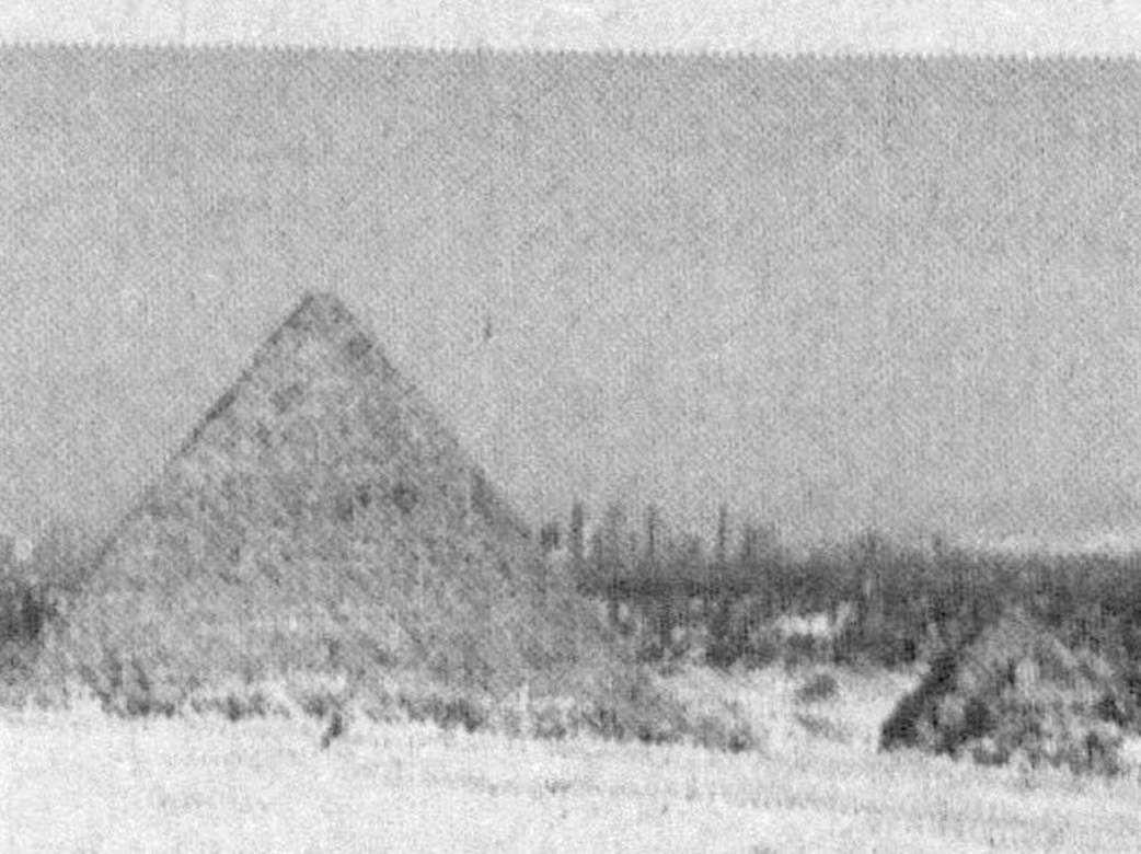
Египетские ученые закупают в пирамиде Хеопса в Гизе робота, чтобы выяснить назначение двух узких шахт, ведущих к вершине сооружения, передает в понедельник агентство Reuters.

Вторая часть затрагивает порядка 283 тысячи пикапов 2003-2005 модельного года, которые оснащены дизельными двигателями и автоматическими коробками передач. У этих автомобилей обнаруживается дефект фиксатора рычага КПП — если не точно поместить его в положение «парковка», то спустя некоторое время машина может самовольно покатиться под уклон. Владельцам отзываемых пикапов до ремонта их автомобилей настоятельно рекомендуется пользоваться штатным стояночным тормозом, а также всегда вынимать ключ зажигания.