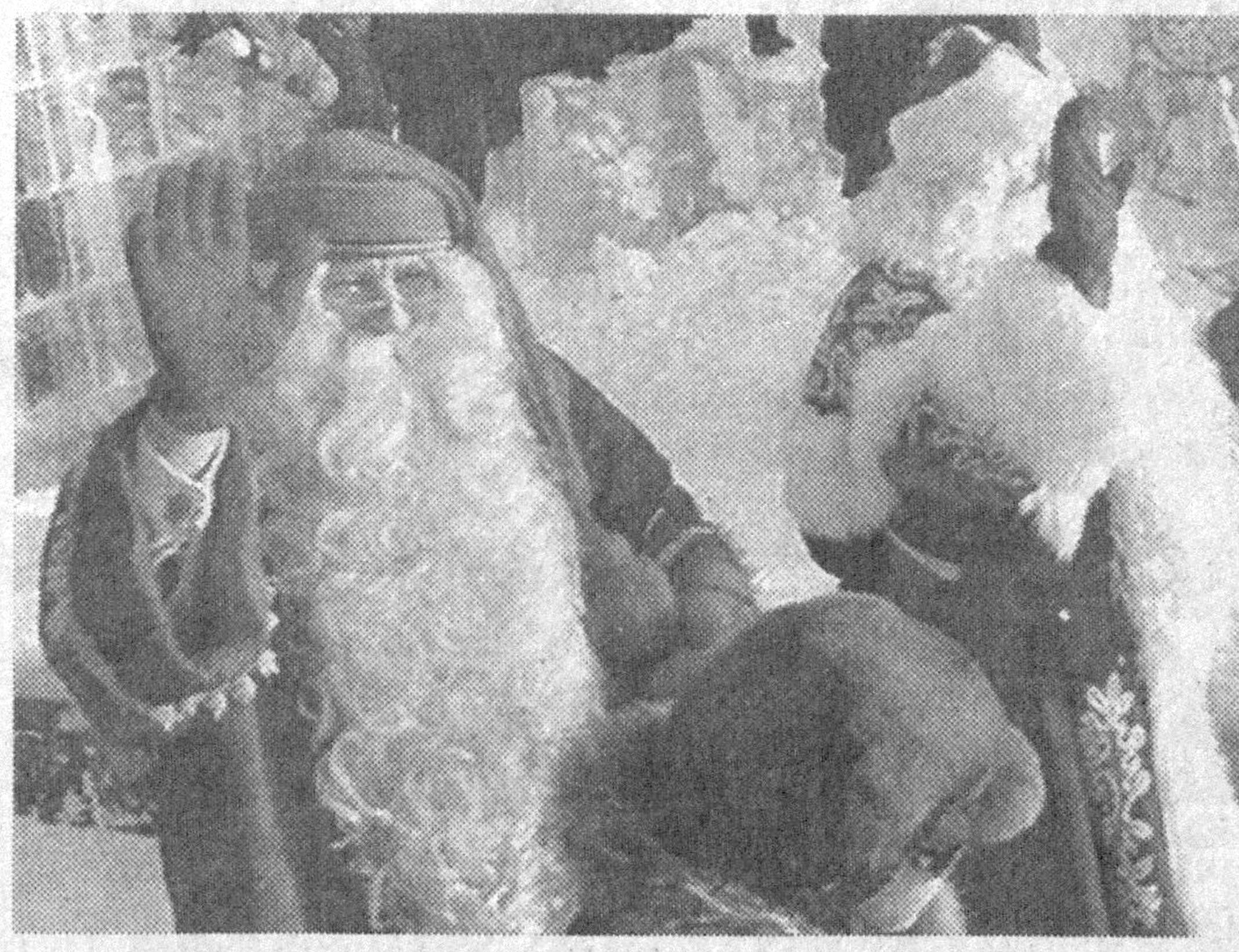
альной встречи каждый год на границе проводятся театрализованные представления с вручением новогодних подарков. Кроме главных героев праздника, на торже-

Встреча Деда Мороза и Санта-Клауса проходит уже восьмой год в рамках акции под названием «Рождество без границ». После офици-