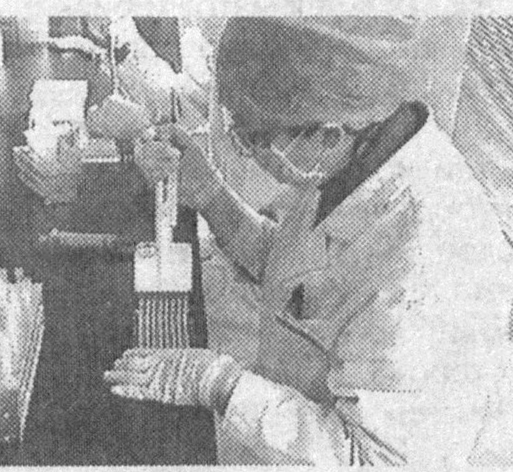
ванных H5N1 скончались, еще троих удалось вылечить.

Анализы, которые брали у больной во время ее нахождения в стационаре, сначала не выявили вирус птичьего гриппа, однако повторное исследование показало, что женщина была заражена H5N1. Это уже пятый подтвержденный случай заболевания птичьим гриппом человека в материковом Китае. Двое инфициро-