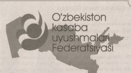
Касаба уюшмаси ҳудудларда

мақ, аввало, оилаларимизни бундай ноҳўя тўқинлардан ҳимоя қилиш муҳим вазифага айланди. Шуни таъкидлаш зарурки, оилаларнинг бузилиш сабаблари ўрганиб чиқилганда, ёшларимизнинг оила қуришга тайёр эмаслиги, соғлиғига эътиборсизлик, йиғитларнинг оилани бошқаришни, рўзгорни моддий таъминлашни, фарзандларни маънан ва жисмонан соғлом қилиб тарбиялашни ўз бурчлари деб билмаслиги, қизларнинг эса уй бекаси, оналик вазифасини тушунмаслиги, аксарият ҳолларда қайнона ва келин ўрта-