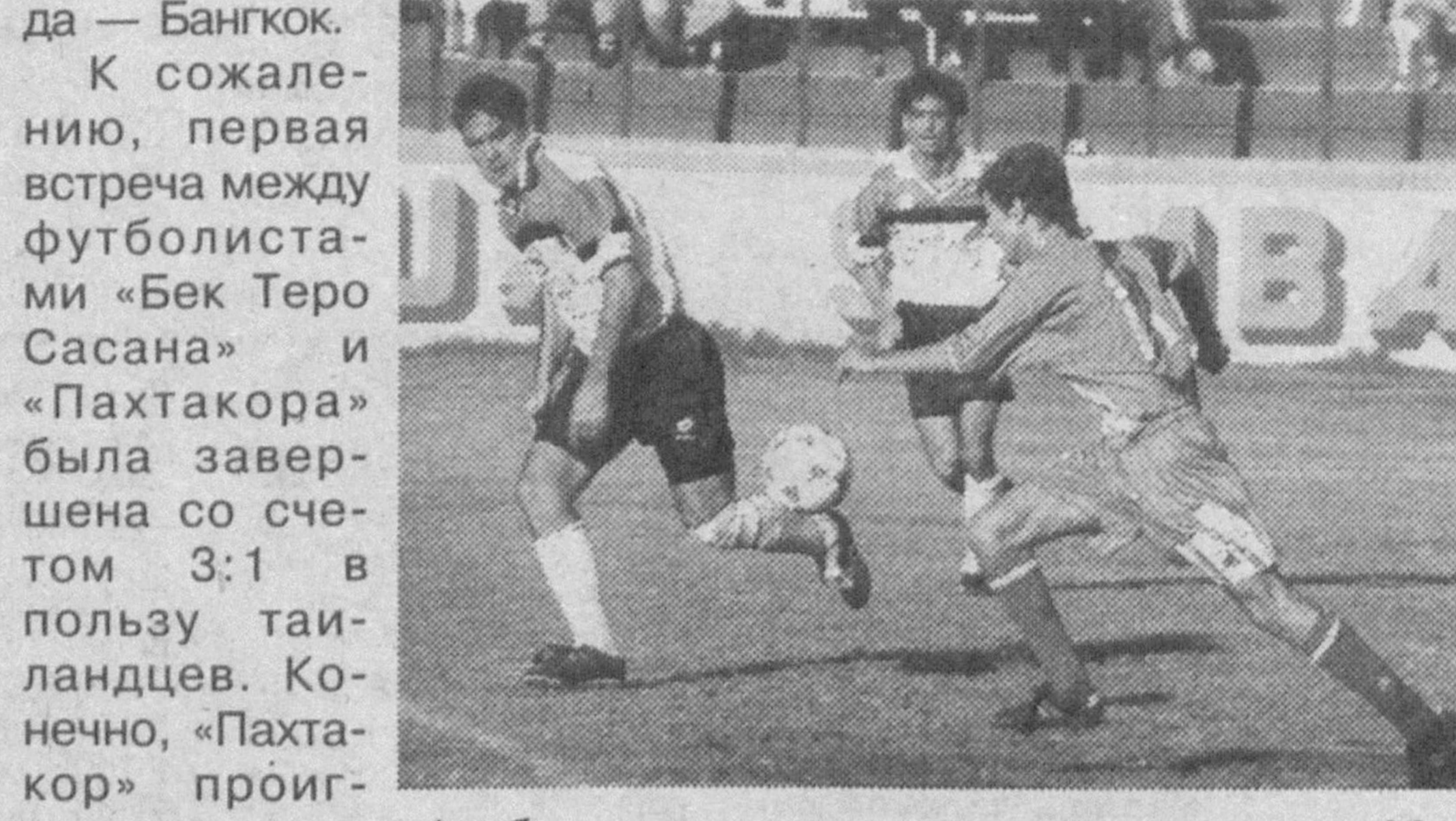
меньше чем в три гола. Мы надеемся, что «Пахтакор», который всегда на своем поле показывает сильную игру, правильно распорядится предоставленной возможностью.

К сожалению, первая встреча между футболистами «Бек Торо Сасана» и «Пахтакора» была завершена со счетом 3:1 в пользу тайландцев. Конечно, «Пахтакор» проиграл, но у наших футболистов еще есть шанс выйти в финал. Для этого «Пахтакор» должен в ответном матче 22 апреля на своем поле обыграть команду «Бек Торо Сасана» с преимуществом не