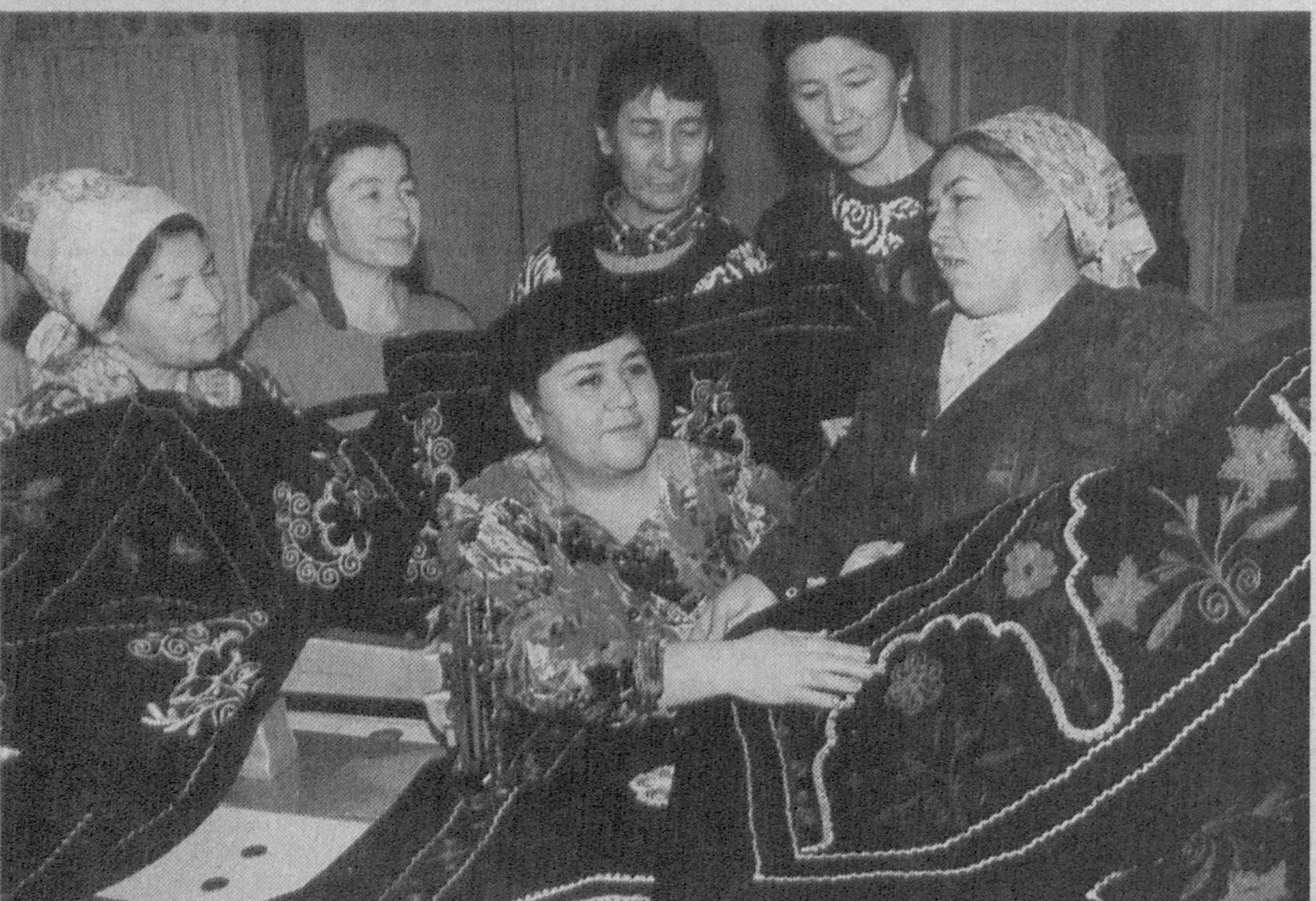
Столичное акционерное общество с ограниченной ответственностью «Шарк гули» занимается изготовлением красочных сувениров, гобеленов, домашних украшений, сувенирных изделий, свадебных костюмов для молодоженов. За второе полугодие 2002 года ООО «Шарк гули» выпустило разнообразную продукцию на 26,5 миллиона сумов. Изделия вышывальщицы пользуются большим спросом у покупателей.

Сейчас такие же спорткомплексы сооружаются и в махалле имени Алишера Навои Алтырарского района и в школе № 47 города Коканда.