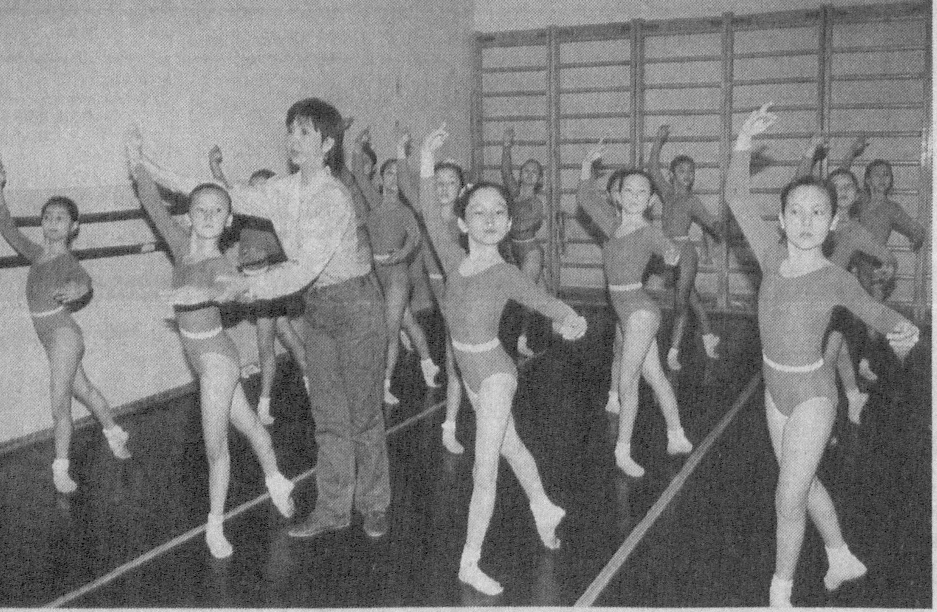
Уже более полувека в Ташкенте работает Высшая школа национального танца и хореографии. Ее выпускники в разные годы демонстрировали свое замечательное искусство во многих странах мира, вызывая восторженные отзывы. В школе преподают высококвалифицированные педагоги, которые любовно передают свои знания и опыт молодым танцорам, воспитывают их.

Кроме наших соотечественников, в них принимают участие около сорока шахматистов из Армении, Катар, Ирана, Вьетнама, Туркменистана, Таджикистана, Казахстана и Кыргызстана. Ожидается, что состязания, которые проводятся в целях развития этого вида спорта в нашей стране, поддержки одаренной молодежи, дальнейшего укрепления дружеских связей, будут богаты интересными и бескомпромиссными встречами. По мнению специалистов, в этих соревнованиях юные шахматисты нашей страны выступят уверенно и достойно.