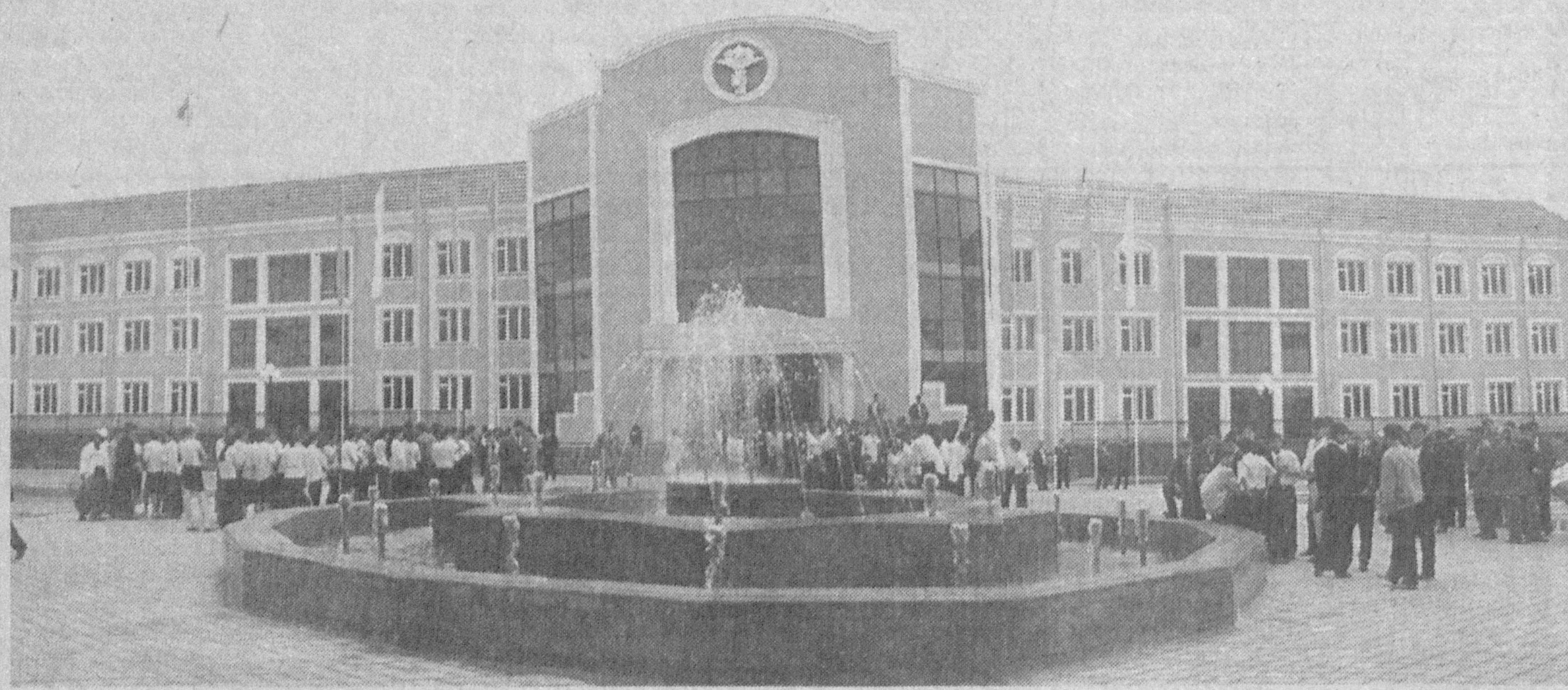
Подборка подготовлена по материалам корреспондентов УзА и газеты «Голос Узбекистана»

зданы все условия для физического воспитания молодежи и проведения соревнований самого высокого уровня почти по 20 видам спорта. С нового учебного года здесь готовят тренеров и учителей физической культуры для начальных клас-