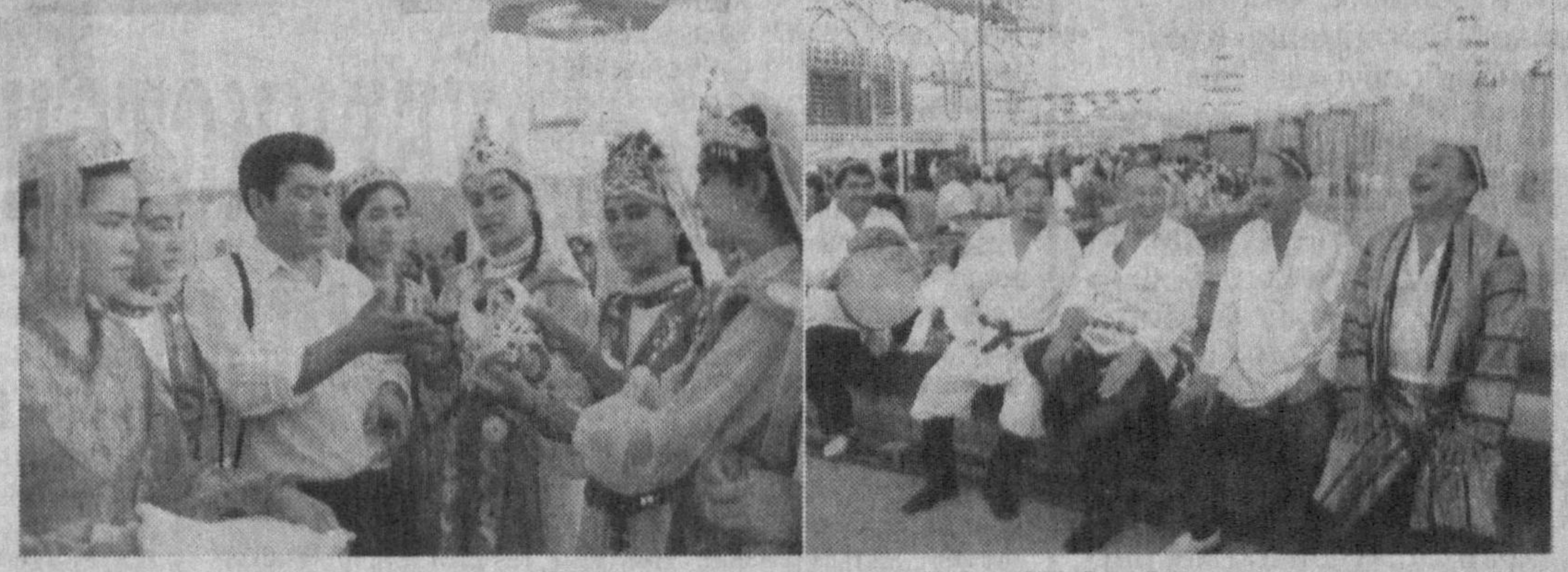
Мустақиллик майдони. Байрам тарадуду.