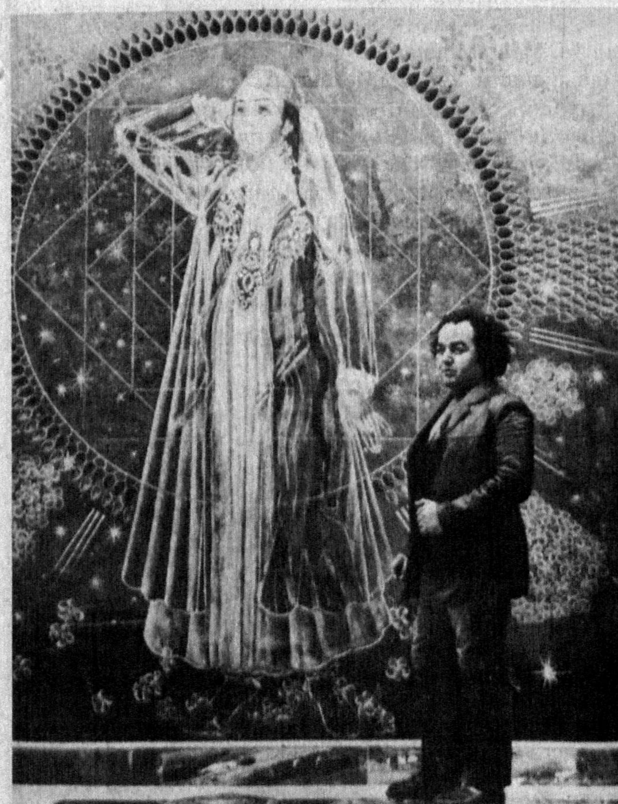
Рассом Б. Жалолов «Рақсини туғилиши» деворий сурати ёнида