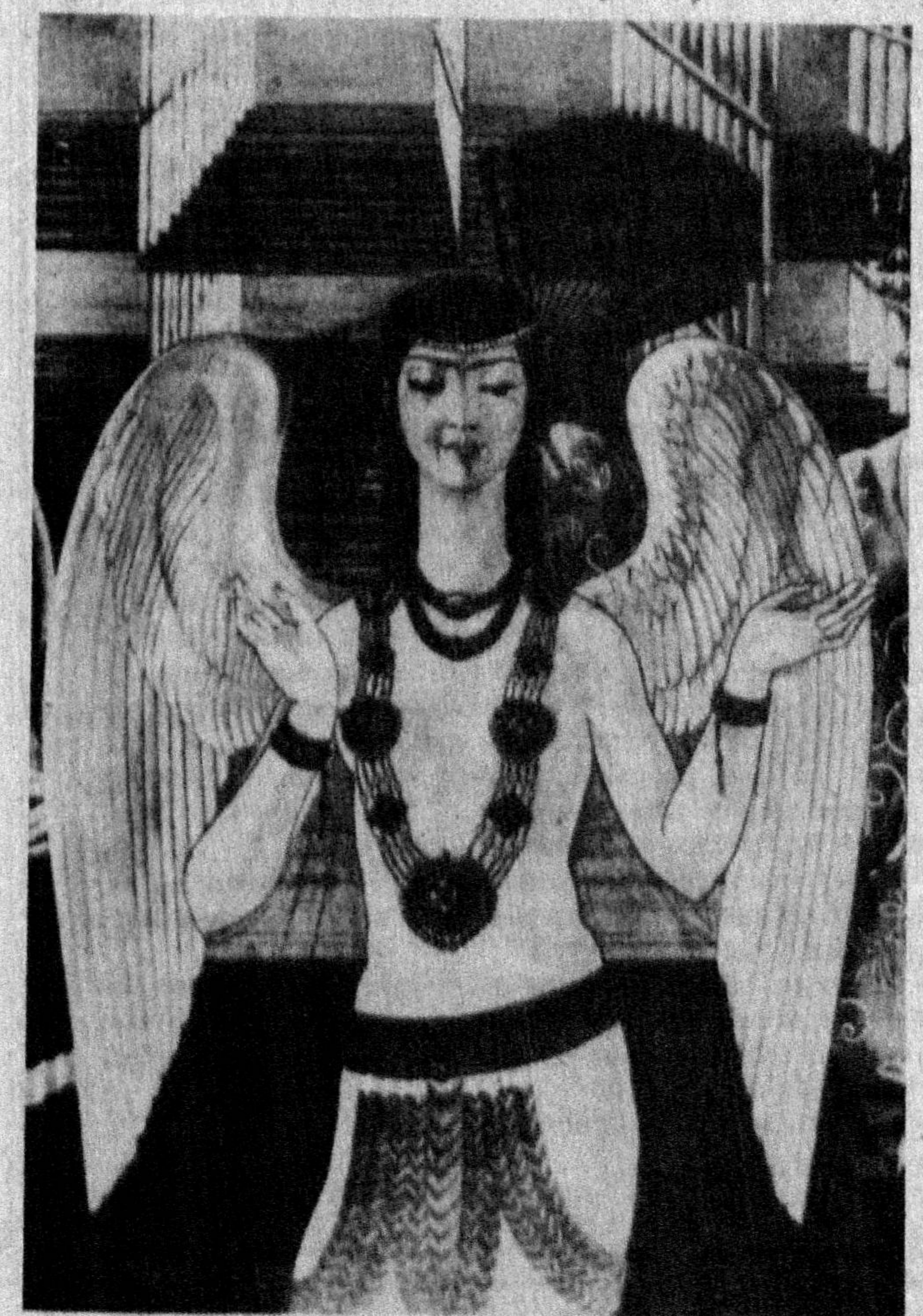
Деворий суратдан парча

Ё Раб, нетайин, не юз қаролиғ бўлди». Безак бериб тилло, қумуш, минолар, Кургим келди сизнинг каби бинолар. Саройимга йигдим мусаввирларни, Буюрдим ёзмакка тасаввурларни. Қай бири бандани тасавир этдилар, Қай бири манзарата манзур этдилар. Меъморлар яратди бинолар тархин, Олтин ўлжаёлмас уларнинг нархин. Шоҳ эдим, битганим фармонлар бўлди, Ҳазаллар шаклида армонлар бўлди. Бир дастимда қилич, бирида қалам, «Бобурнома» — дардли дилимдан нолам. Юрт олдим, ҳеч юртда таскин топмадим, Жаҳонда ўзимдай мискин топмадим. Тасалли беролмас на тахт, на ҳарам, Ҳиндга шоҳ эрурман, Ватанга қарам. Юртимга яқинроқ бормоқ истадим, Қобулга кўминглар дедим жасадим. Бобо, каминангиз Мирзо Бобурман, Ўзга юртда қолган мангу собирман.