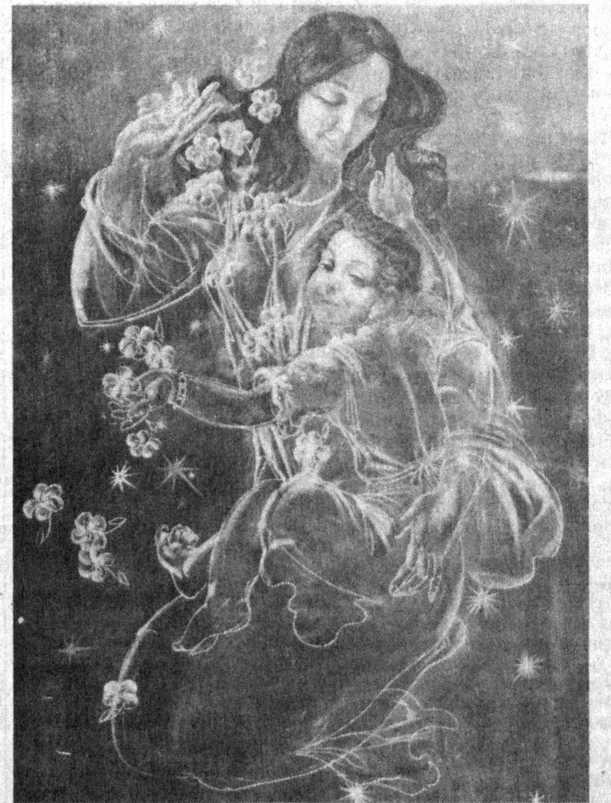
Деворий суратдан парча

Суйса-да уруғлар бир-бирларини, Ёйига олдириди кўп сирларини. Баъзиси сиз кутган мард бўлмадилар. Пойингизга арзир гард бўлмадилар. Вилоят талашдан толеъ букилди, Бегуноҳ фуқаро тутдек тўкилди. Талотўпда қолса ҳамки диёрим, Умидворлиг бўлди менинг шiorим. Тарих сахнасига келдилару бот — Темурзодалардан қолди яхши от. Ушал султонлардан Улуғбек эрур, Ул буюк зот бугун бунда ўлтирур. Ва яна биттаси — буюк мусофир — Ёнида ўлтирган — шоҳ Мирзо Бобур. Сўзлар мўъжизот ҳазрат Навоий, Улусга бўлмади ончалик ҳомий. Хотирингиз мудом айладилар ёд, Темурзодалардан қолди яхши от. Эй дарё Амирим, эй уммон Амир, Каҳхашон бағрида жовидон Амир, Сизга ўз нигоҳин ташларкан башар, Куёшга боққандек кўзи қамашар. тизага қўлларни тираб сиз ҳамон — Термулиб турибсиз келажак томон... Давр марди: Аллоҳ улуг қилди сизни зиёда, Бобо, мен ҳам битта теурийзода. Доим иззат қилдим ёшу қарини, Атрофимга йигдим оқиларини. Фоят чуқур ўйлаб ишлар юритдик, Хурликни қон тўкмай қўлга киритдик. Баъзида фитнага, сирга тутилдик, Шукрим, баридан омон кутулдик. Қадамни ташладик бунёд ишидан, Ақл чикса, олдик фақир кишидан. Мақсадим — иймонли диндан чикмасин, Юрт тинч бўлсин, ханжар қиңдан чикмасин. Нокас тикилмасин элнинг нониға, Тўқинчилик энсин дастурхониға. Бобо, ҳали йўлнинг бошидадурмиз, Талай муаммонинг қошидадурмиз. Ҳали қилар ишлар етиб ортадур, Сарҳисоб айтурга менга эртадур. Суянгон тоғимдур халқим, Туркистон, Уммедим — қўллағай муқаддас Куръон.