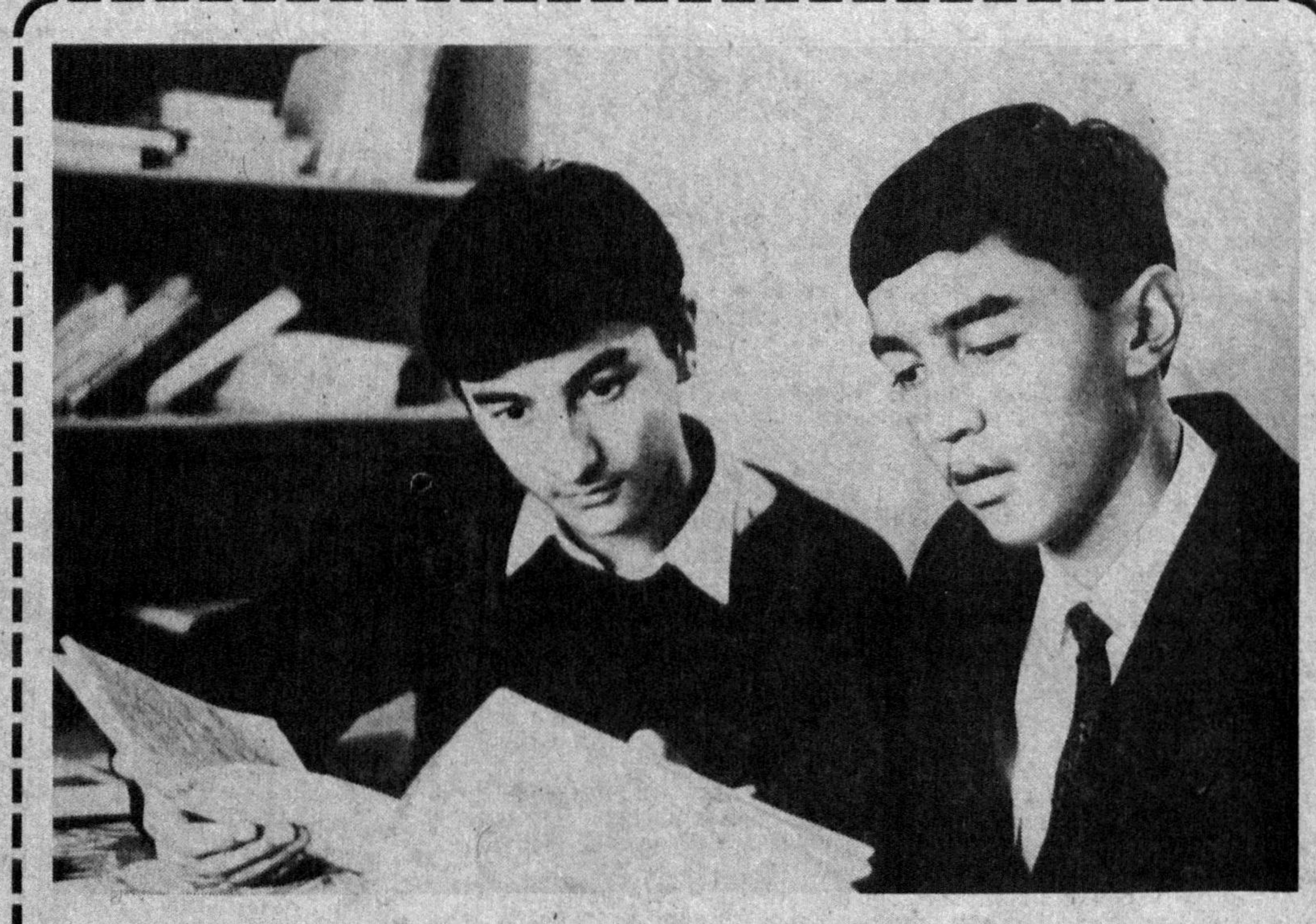
Ёшларимиз илм ўрганишга ташна

нинг муаммолари ҳақида гапириб, ўша пайтнинг раҳбарларига ёшларнинг ишончсиз-