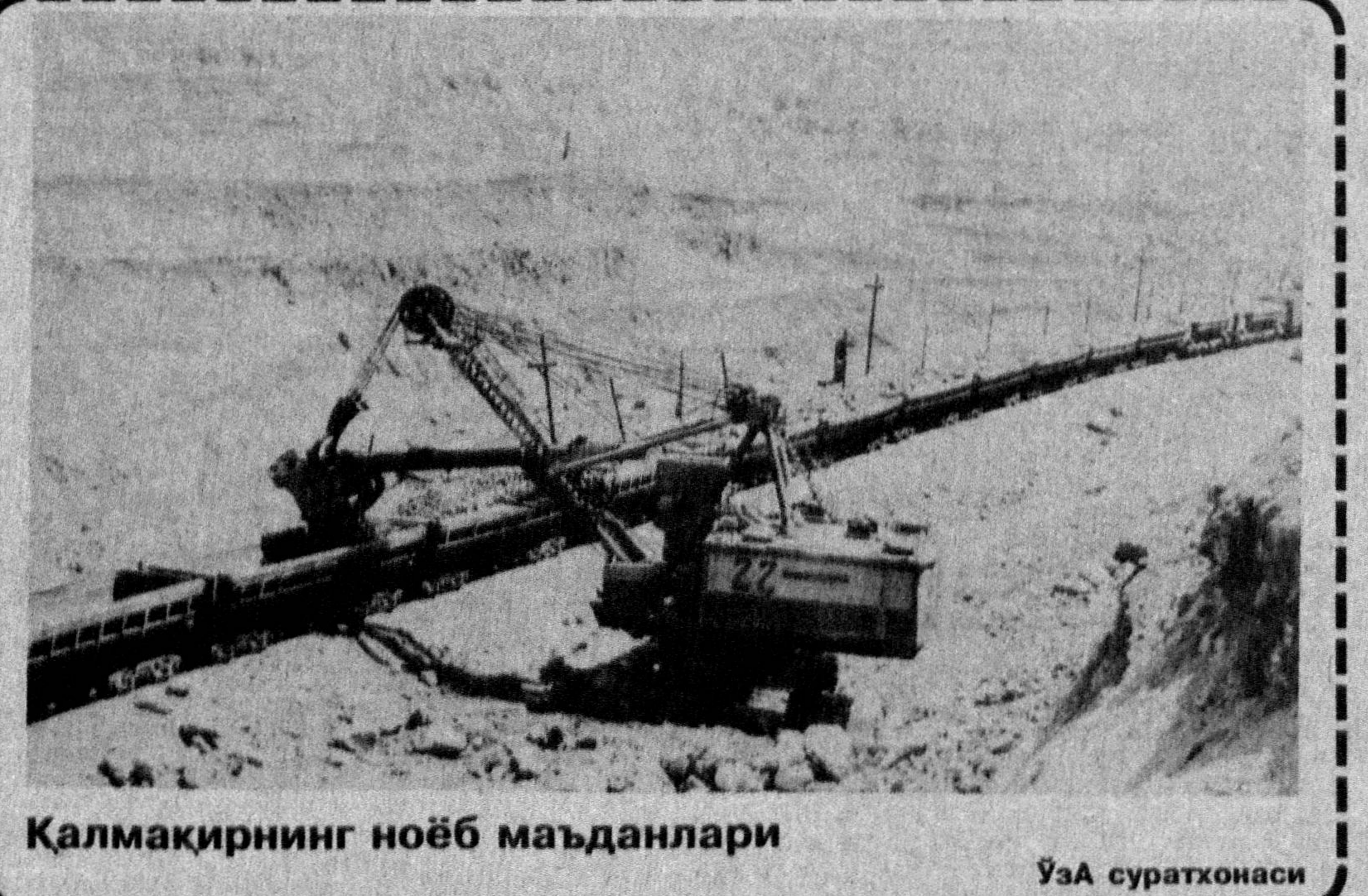
Қалмақирнинг ноёб маъданлари ЎзА суратхонаси

Нақадар париваш бўлса ҳам баҳор! Барибир ўтқинчи, беор, бевафо... Бахтимга сен борсан, аҳди барқарор Демак, тирик ҳали севги ва ҳаё... Сир эмас, дилимиз, тилимиз ҳам бир, Бир олмангиз гўё икки бўлаги... Иккимиз ҳам эгу тилакка асир, Ё Олло! Шайтоннинг борми кераги?!