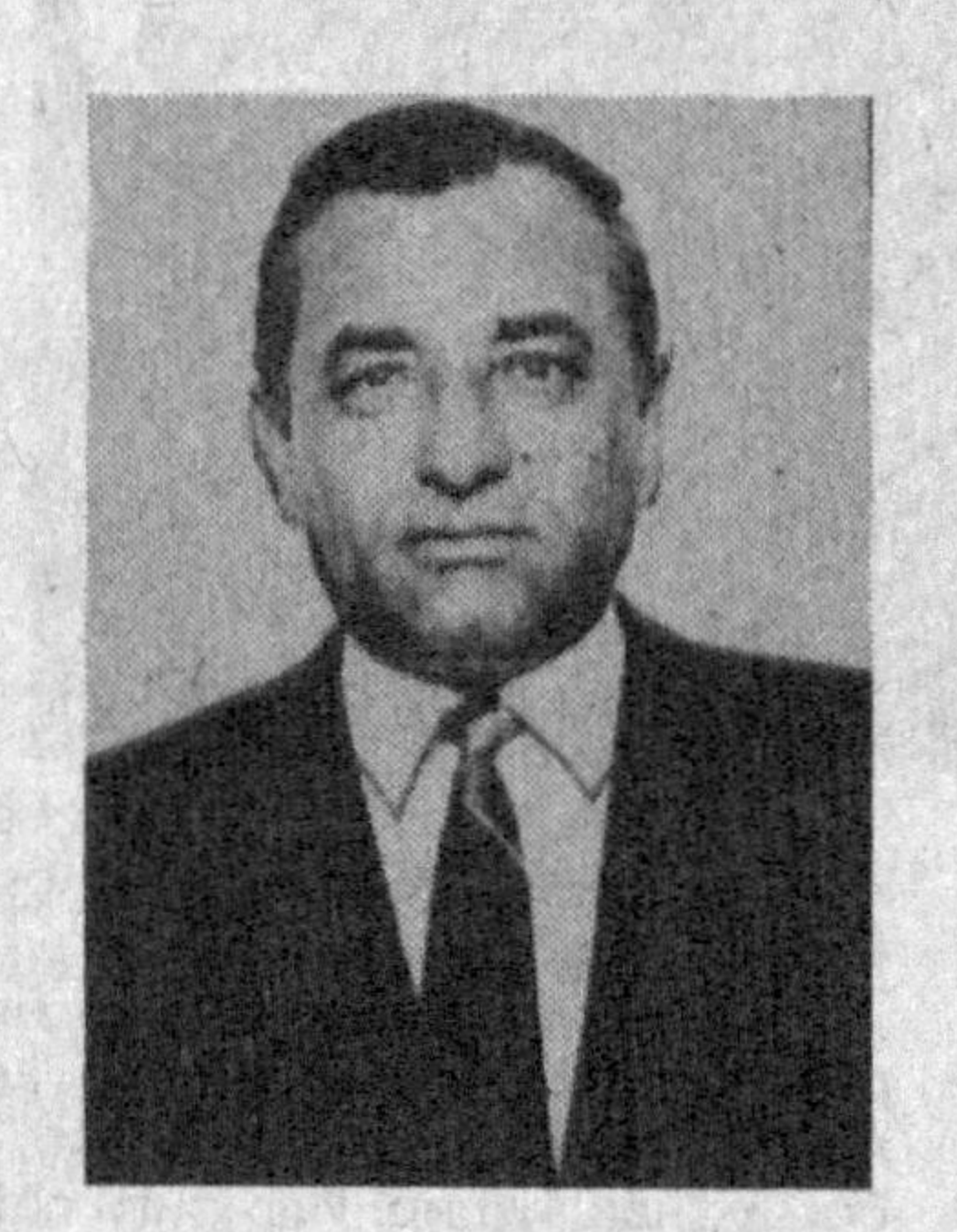
хон бизга нималарни ваъда этаркин?

ўлка тарихи ҳам Туронзамин, ўзбек халқи тарихи каби жуда қадимий. Нархастий, Мирзо Азим Сомий Бустоний, В. А. Шишкин, А. Ю. Якубовский, В. В. Бартолд, Я. Фуломов, О. В. Обелченко, А. Муҳаммадзонов сингари йирик олимлар шундан гувоҳлик берадилар. Буюк Ипак йўли шу ердан ўтган. Қизилтепа қадим-қадимда Бухоро, Марв, Шош, Самарқанд шаҳарларини бир-бирига боғловчи ҳалқа бўлган. 336 километрик Канпирак истехком деворининг анча қисми Қизилтепанинг жанубий-шарқидан ўтган. Ҳозир ҳам Уртачўл ва Чўлималик яйловларида Шайривайрон, Оксоч, Лавандоғ тепалиқларида бу девор қолдиқларини кўриш мумкин. ...Араблар VIII аср бошида Бухородан шимолий шарқ томон юриш қила туриб, гўзал бир шаҳарчага дуч келадилар. Бу ўнинчи аср олими Муҳаммад Наршахийнинг «Бухоро тарихи» китобида баён этилишича, айни