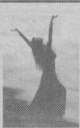
(Продолжение. Начало в №№42-44)