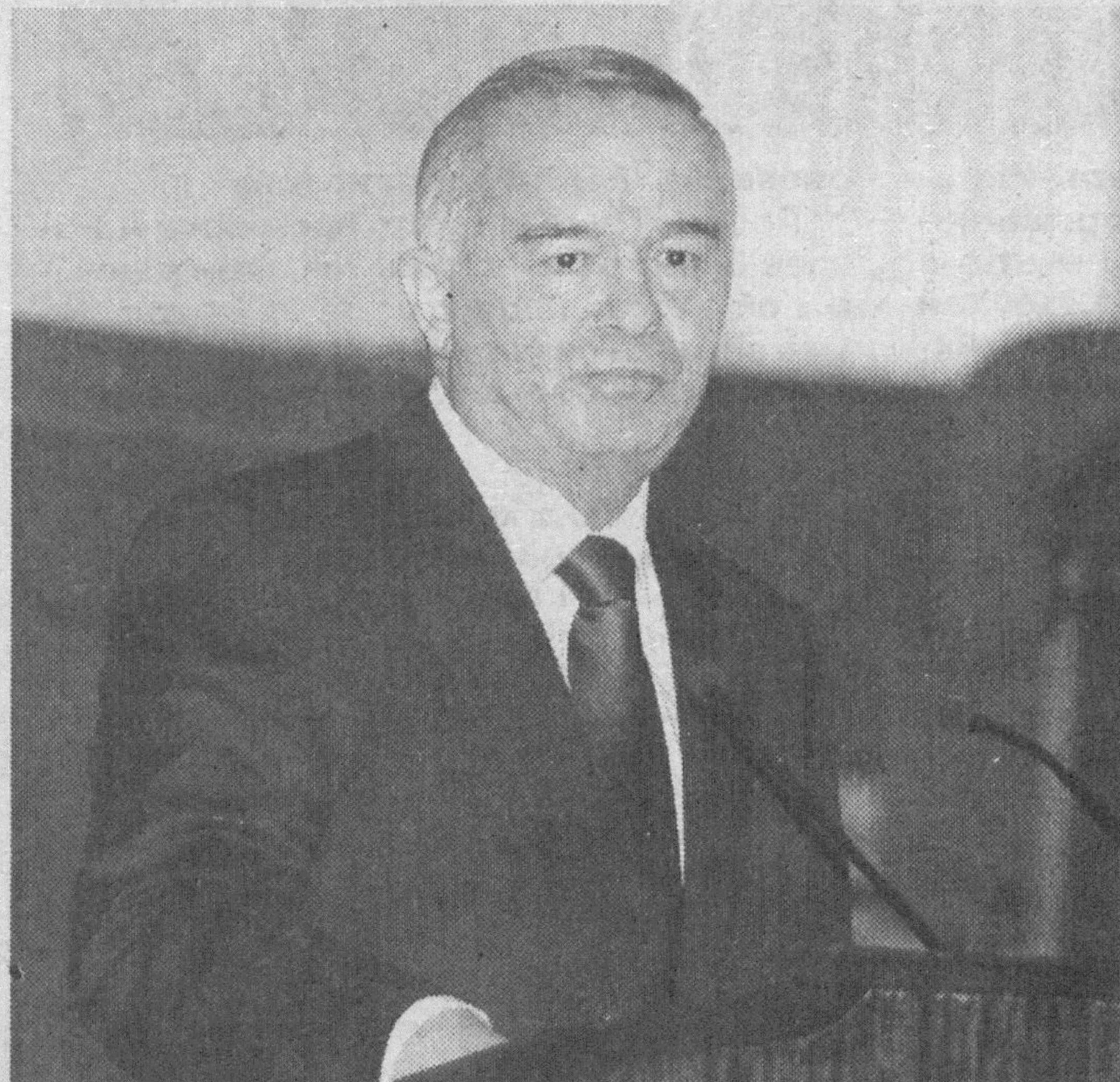
В Ташкенте 11 декабря начала свою работу тринадцатая сессия Олий Мажлиса Республики Узбекистан второго созыва.

В работе парламентской сессии принимает участие Президент Республики Узбекистан Ислам Каримов.