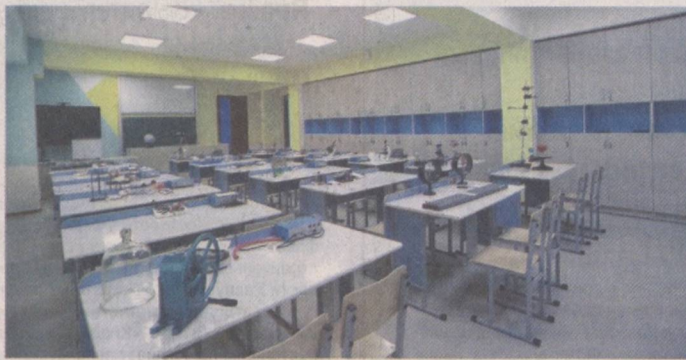
м² ҳудуд обод қилинди. 329-сонли умумтаълим мактаби 1 680 ўринга мўлжалланган бўлиб, ўқувчиларнинг

Мазкур тумандаги 2-қурилиш участкаси. Бу ерда кўп қаватли уйлар ўз эгаларига топширилган. Бироқ, ушбу ҳудудда истиқомат қилаётган ўғил-қизлар учун умумтаълим мактабига зарурат бор эди. Шу мақсадда бу ерда 4 қаватли, барча шарт-шароитларга эга янги мактаб қуриб битказилди. Умумий майдони 16 083 м² бўлган ҳудудда қурилган ушбу таълим