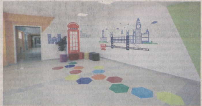
муассасасининг фойдаланиш майдони 3 940 м² ни ташкил этиб, 4 799 м² жой кўкаламзорлаштирилиб, 7 344

Наргиза ХАЙРУЛЛАЕВА, «O'zbekiston bunyodkori» мухбири.