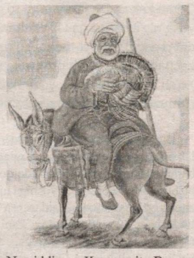
Nasriddin va Karmensita Buxoroda" konsert baleti singari asarlar yaratildi.