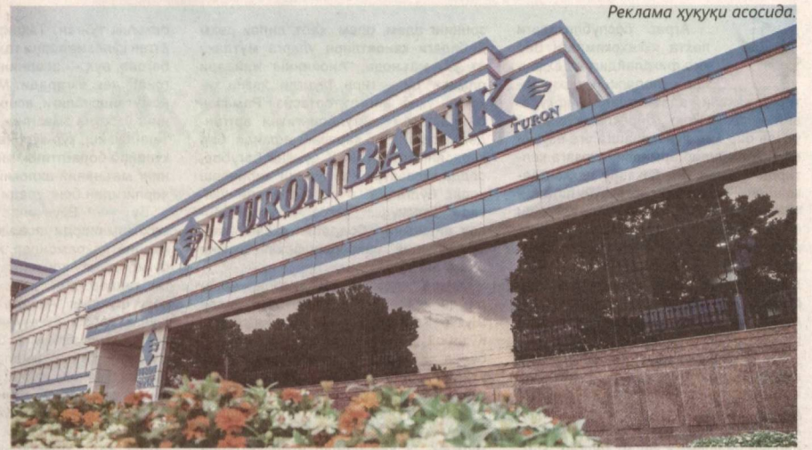
Реклама ҳуқуқи асосида.