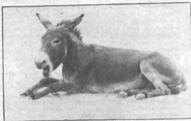
А где же Афанди?

О вреде куренья. Если делать каждый день Чудо-физзарядку, Убежит с позором лень В омут без оглядки. Уверяю: через год, Если взяты смело, — Полноте на нет сойдет, Будет в норме тело!