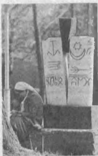
Ташкент. В скверике возле памятника Ю. Ахунбаеву.