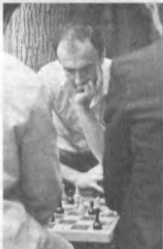
Ох, как трудна эта древняя игра...