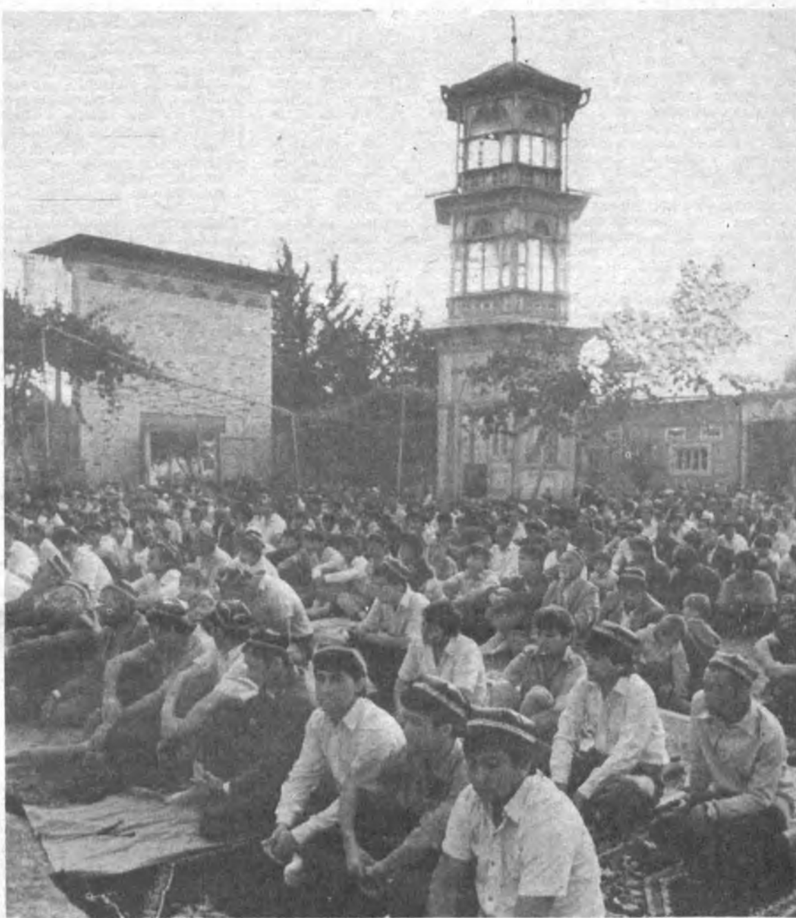
НА СНИМКЕ: праздничный намаз в мечети Мирзо Юсуфа в Ташкенте.

Реализуются меры по социальной защите населения, в частности до обеспечения населения города