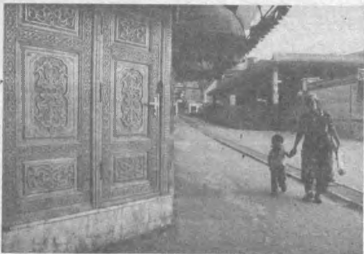
Древний и вечно юный Самарканд