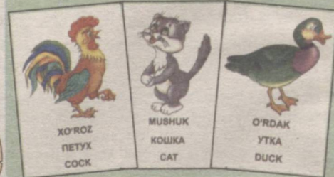
XO'ROZ ПЕТУХ COCK