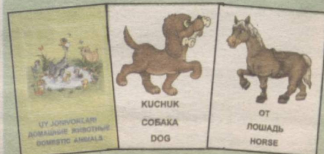
UY JONIVORLARI ДОМАШНИЕ ЖИВОТНЫЕ DOMESTIC ANIMALS