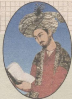
ZAHIRIDDIN MUHAMMAD BOBUR