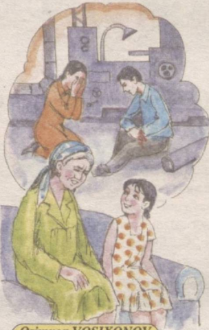
Osimxon VOSIXONOV chizgan rasm

Buvimni qo'yarda-qo'yamay xotiralarni so'zlab berishga ko'ndirdim.