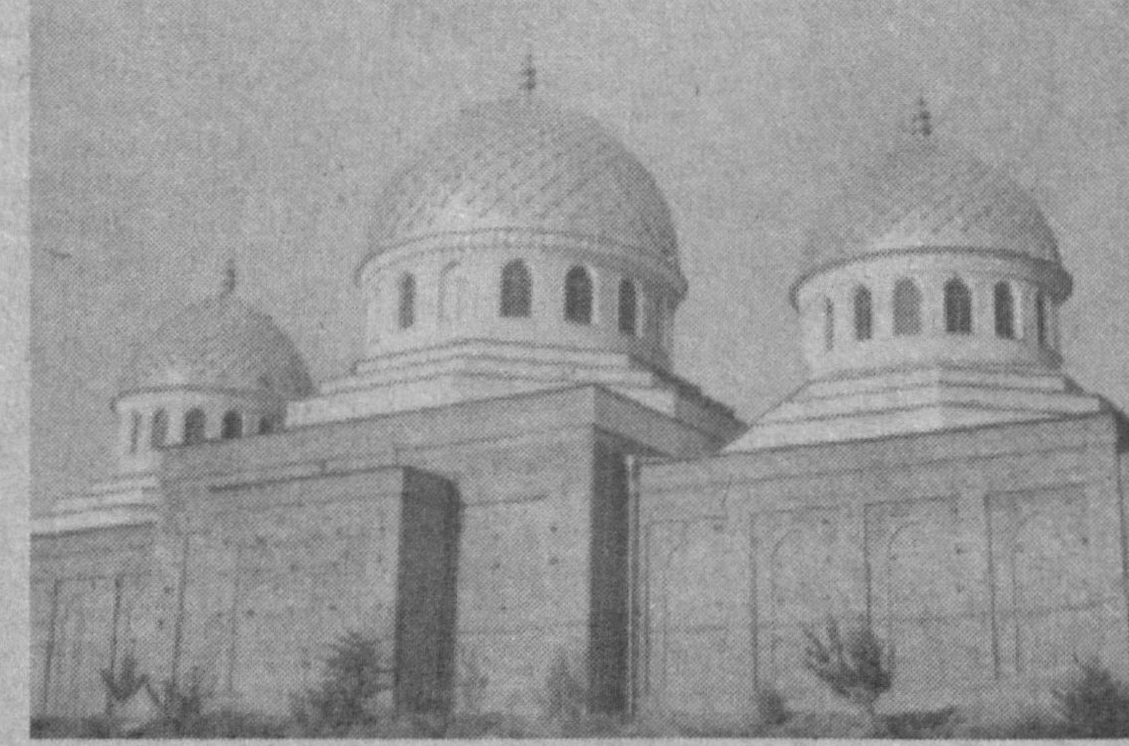
Кўкалош мадрасаси, Хатиранинг қўлидаги мадраса...

Кўкалош мадрасаси Ўзбекистондаги энг ноёб меъморий обидалардан бири ҳисобланади.