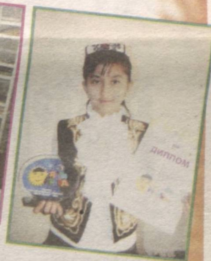
Bugungi kunda 70

ta ta'lim muassasasida 1000 dan ziyod quyon parvarishlanmoqda.