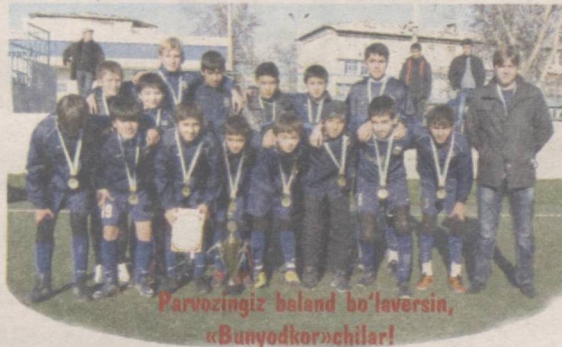
Parvozingiz beland bo'lersin, «Bunyodkor»chilar!

ikkinchilik «Spartak»chilarga, uchinchi o'rin «Lokomotiv»chilarga, to'rtinchi o'rin esa ROZKchilarga nasib etdi.