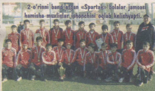
2-o'rinni band qilgan «Spartak» bolalar jamoasi hamisha muxlislar ishonchini oqlab kelishyapti.

ning olti nafar tarbiyalanuvchisi bilan Kiyevga bordik. Ular u yerda murabbiylar ko'rigidan o'tishdi. Ikki haftalik imtihonlardan so'ng, ikki nafar shogirdim Kiyevning «Dinamo» klubi akademiyasiga qabul qilindi. 1996-yilda tug'ilgan