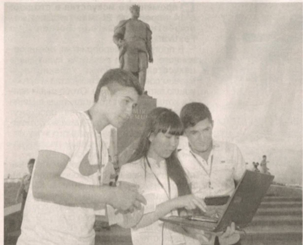
Фото представителей Союза молодежи.

В Шахрисабзе стартовали культурно-просветительские мероприятия, посвященные 683-летию со дня рождения великого полководца и государственного деятеля Амира Темура.