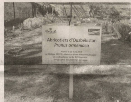
В Рюэй-Мальмезоне создан первый за рубежом, в частности, в Европе Узбекский сад и возведен на его территории памятник великому сыну узбекской земли — Абу Али ибн Сино.