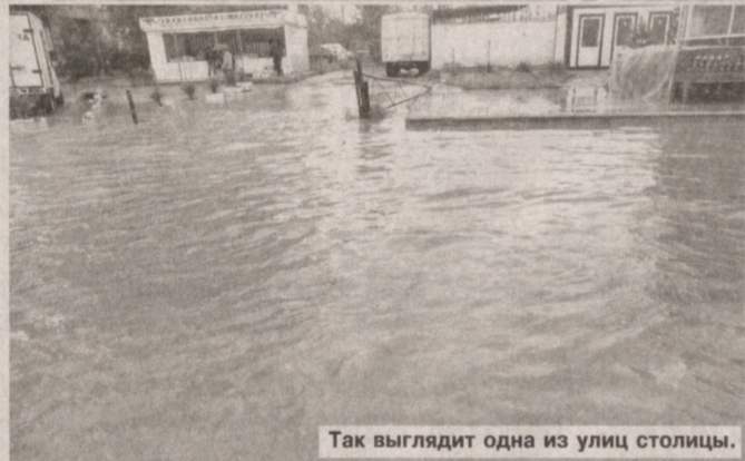
Так выглядит одна из улиц столицы.

На формирование климата нашей страны оказывают влияние географическое положение — на юге умерен-