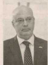
Алан Мельцер, временный поверенный в делах США в Узбекистане:

— Форум имеет важное значение для всех его участников. Обсужденные в течение двух дней вопросы, в частности, касающиеся судебно-правовой сферы, послужат ее развитию. В ближайшее время в целях обеспечения верховенства закона планируем реализовать с Министерством юстиции и Верховным судом Республики Узбекистан совместный проект на 12 миллионов долларов. Сотрудничество в этом направлении между двумя странами будет укрепляться.