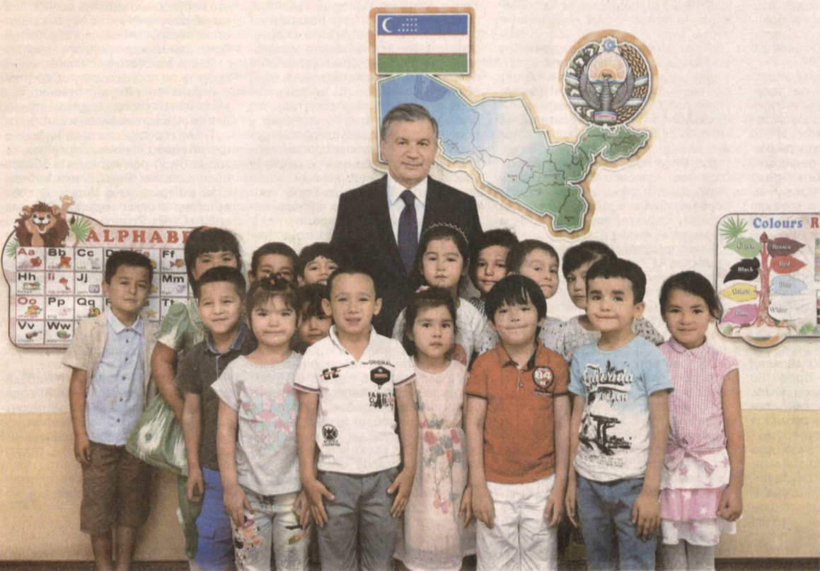
Президент Республики Узбекистан Шавкат Мирзиёев в целях ознакомления с ходом реформ по социально-экономическому развитию регионов, осуществляемой созидательной работой и реализацией данных ранее поручений 16 мая прибыл в Андижанскую область.

В ходе визита главы государства в область 19–20 мая прошлого года были определены важные задачи по социально-экономическому развитию региона. За прошедший период особое внимание уделялось исполнению данных поручений. В области были благоустроены города и села, повысилось благосостояние населения. Достигнуты весомые результаты в развитии промышленности, строительства, фармацевтики, малого бизнеса и частного предпринимательства, социальной сферы. Наблюдался рост по всем макроэкономическим показателям.