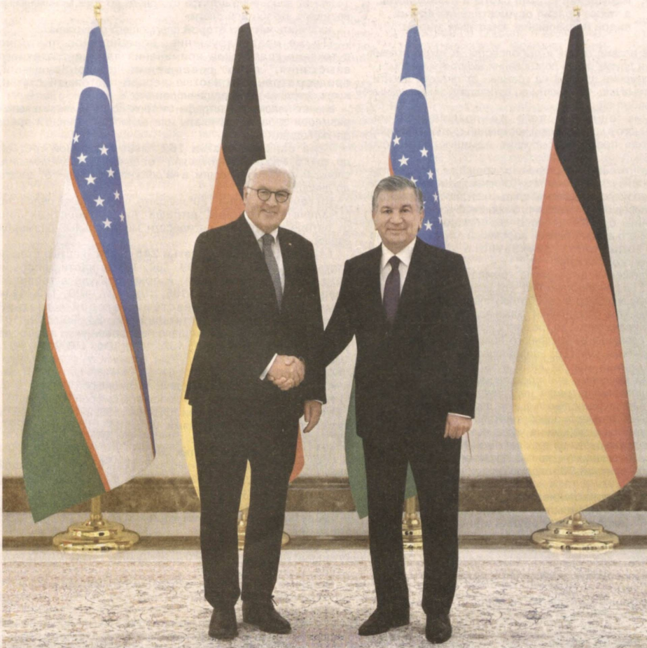
Как сообщалось ранее, по приглашению Президента Республики Узбекистан Шавката Мирзиёева Федеральный Президент Федеративной Республики Германия Франк-Вальтер Штайнмайер 27 мая прибыл в нашу страну с официальным визитом.

Основные мероприятия визита прошли 28 мая в резиденции Куксарой. После церемонии официальной встречи Шавкат Мирзиёев и Франк-Вальтер Штайнмайер провели переговоры в узком и расширенном форматах. Глава нашего государства искренне поздравил Президента и народ Германии с исторической датой — 70-летием образования Федеративной Республики Германия и принятия ее Основного закона. Федеральный Президент Германии поблагодарил лидера Узбекистана за приглашение посетить с визитом нашу страну и оказываемый теплый прием. Между Узбекистаном и Германией поддерживается последовательный политический диалог. Франк-Вальтер Штайнмайер посетил нашу страну в 2006 и 2016 годах в качестве министра иностранных дел ФРГ. Безусловно, нынешний визит будет способствовать укреплению отношений дружбы и сотрудничества на основе принципов единства и равноправия, взаимного доверия и учета интересов. Наши страны тесно взаимодействуют в рамках международных структур, таких как ООН, ОБСЕ, по глобальным и региональным вопросам. Узбекистан поддерживает стремление Германии стать постоянным членом Совета Безопасности ООН. Кроме того, активные связи в рамках